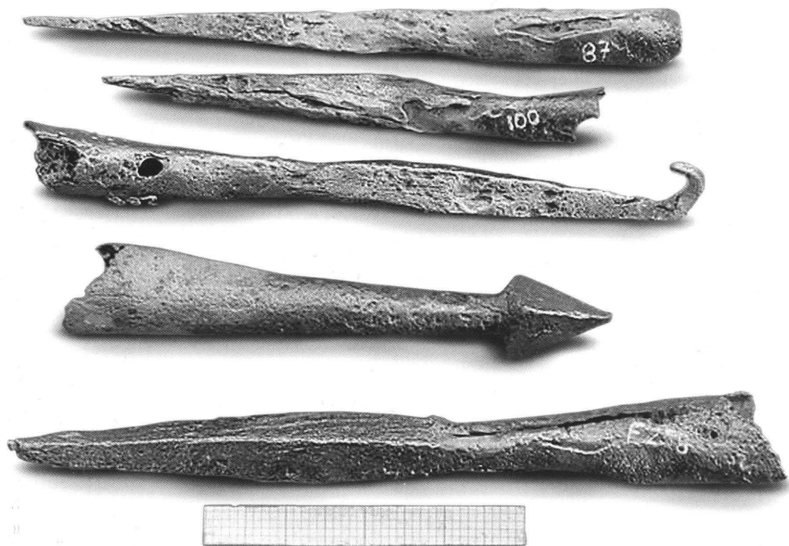
Fig. 4. Alcune punte di freccia del XII-XIII secolo