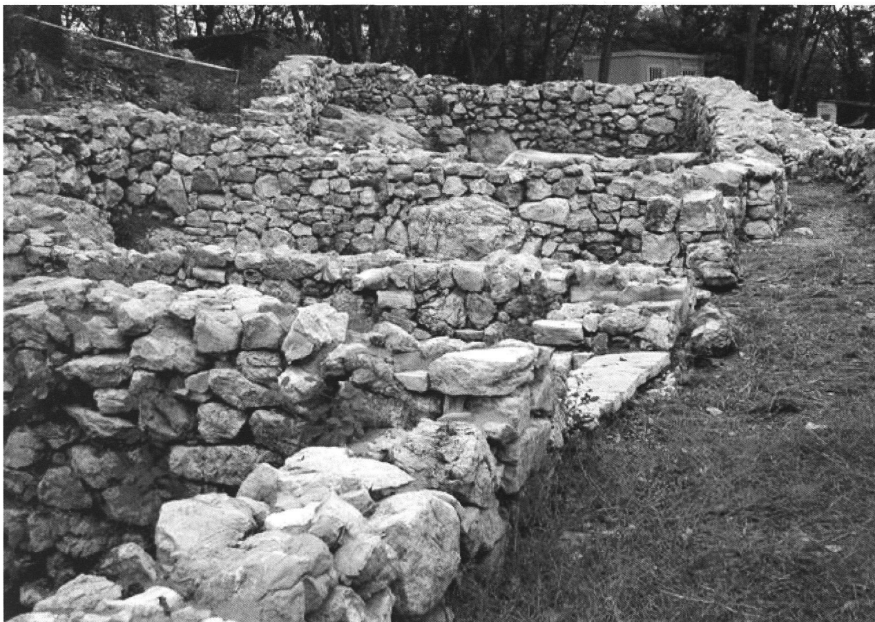
Fig. 2. Il vicolo con alcuni degli edifici del blocco settentrionale

La frequentazione della collina durante il periodo delle invasioni barbariche, segnalata da alcuni finilini in bronzo nel 1991-1993, è confermata da due scheletri ritrovati nel 2002.