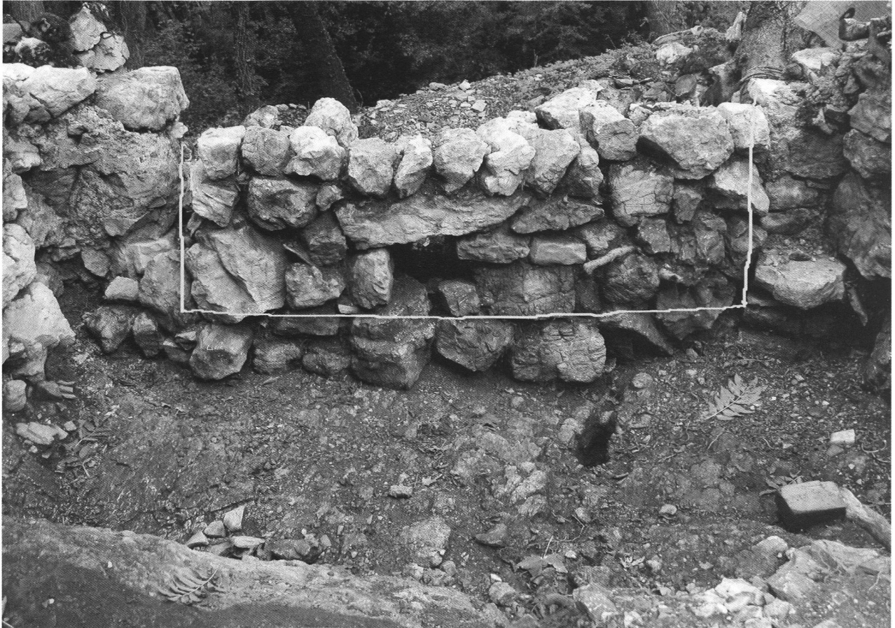
Fig. 3. L'E14 con l'accesso murato e la pietra porta cardine

Il primo, di un bambino di ca. 4 anni è datato al 650-780 d.C., il secondo, di un prematuro di 28 settimane, è datato fra il 540 e il 660 d.C. Allo stesso periodo appartengono anche alcuni frammenti di bicchieri di vetro rinvenuti all'interno dei vani dell'E5.