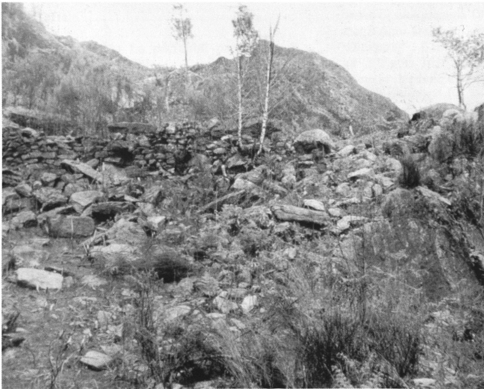
Particolare delle emergenze murarie all'epoca delle ricerche del Frick