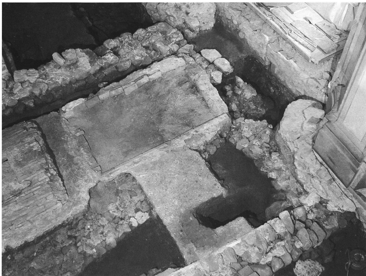
Veduta generale della chiesa romanica, con in primo piano i sepolcri del Seicento