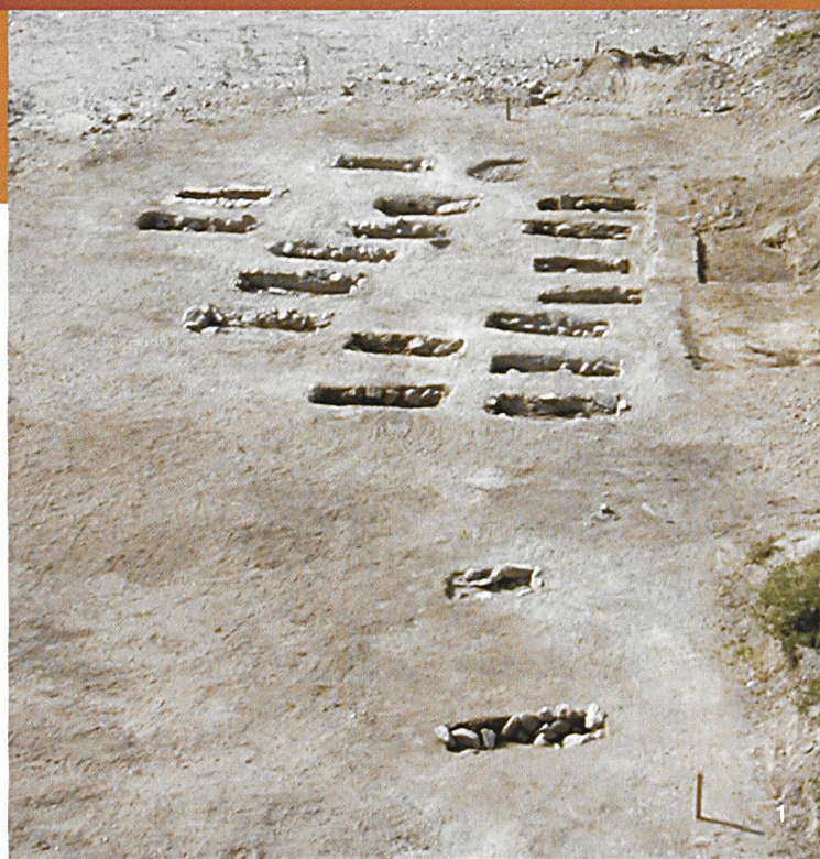
1 La necropoli di Solduno (foto UBC, D. Calderara) 2 Planimetria riassuntiva degli scavi finora condotti a Locarno-Solduno. Evidenziate le varie epoche dei ritrovamenti (elaborazione grafica UBC, F. Ambrosini)

Il cantiere AlpTransit di Biasca, nella località definita Giustizia , ha richiesto una prospezione archeologica e la riconsiderazione delle conoscenze finora note sui ritrovamenti.