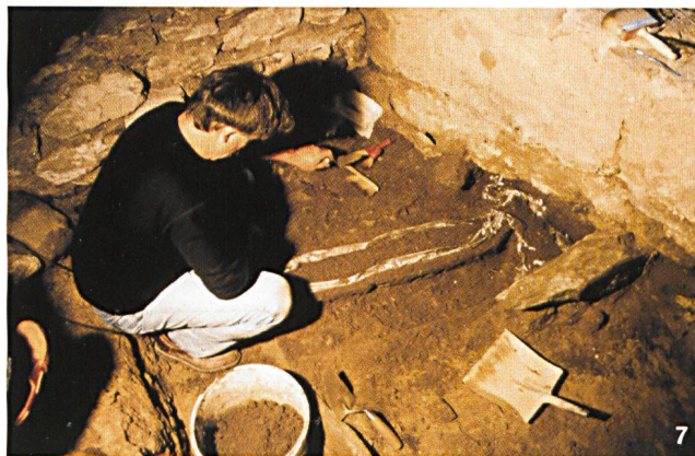
7 San Carpofo di Gorduno. Il recupero del corredo longobardo

borazione con il Servizio inventario, la supervisione sulle esposizioni presso il Castello di Montebello e il Castelgrande a Bellinzona, la collaborazione con istituti, enti esterni e associazioni presenti sul territorio, la consulenza a studenti e studiosi, la partecipazione alla creazione del Museo cantonale del territorio, per quanto riguarda il settore pertinente l'archeologia.