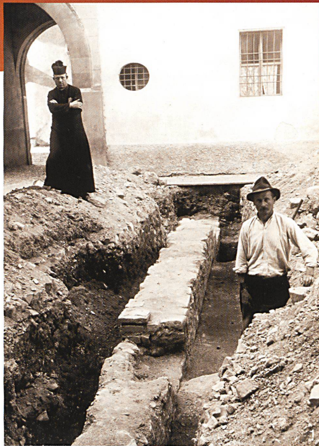
1 Battistero di Riva San Vitale. Ritrovamento del peribolo durante le ricerche del 1919-1925

Proprio per questo la Svizzera è da annoverare fra i promotori del Comitato internazionale per lo studio del Medioevo , che venne istituito subito dopo la guerra e che ebbe modo di organizzare importanti colloqui