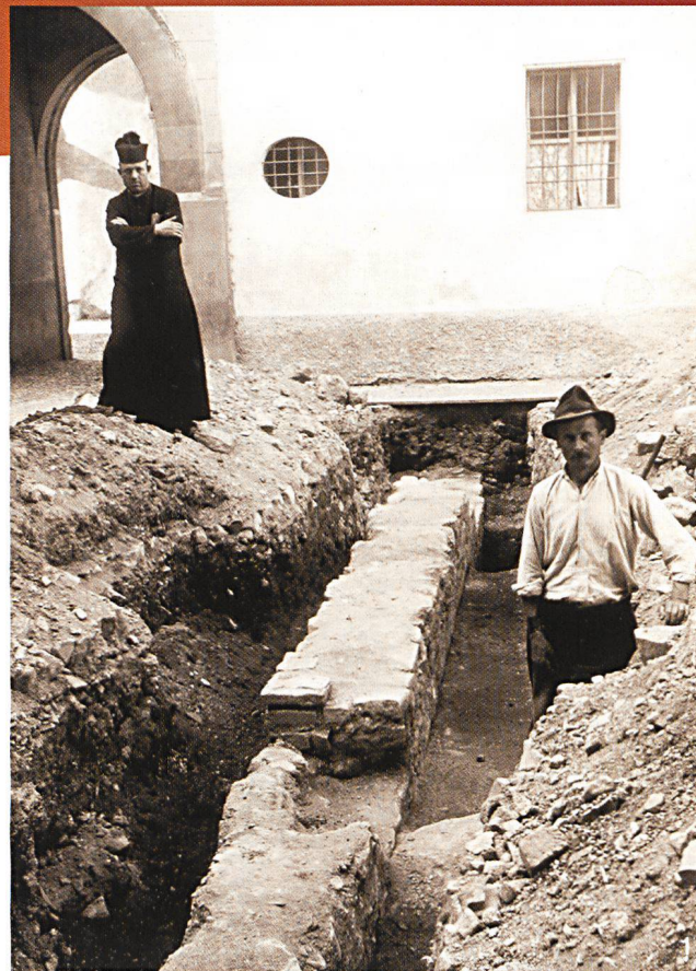
1 Battistero di Riva San Vitale. Ritrovamento del peribolo durante le ricerche del 1919-1925

Proprio per questo la Svizzera è da annoverare fra i promotori del Comitato internazionale per lo studio del Medioevo , che venne istituito subito dopo la guerra e che ebbe modo di organizzare importanti colloqui