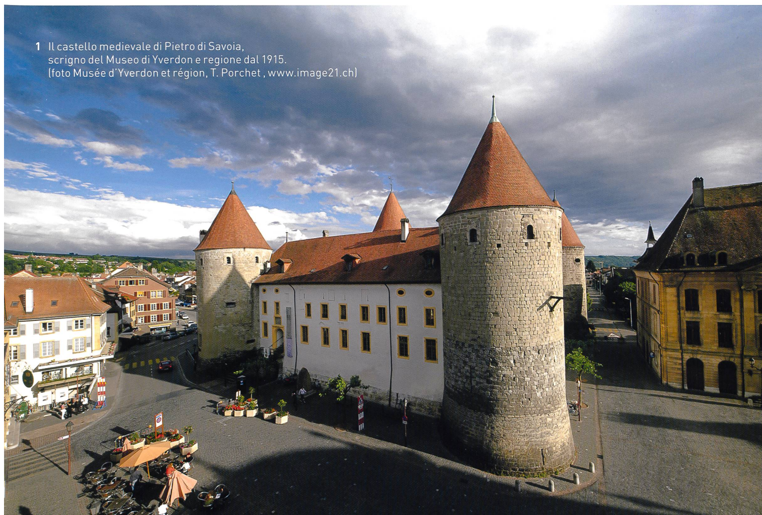
1 Il castello medievale di Pietro di Savoia, scrigno del Museo di Yverdon e regione dal 1915.

Data la sua rilevanza, fu del tutto naturale che il museo si trasferisse nel castello medievale di Pietro di Savoia (XIII secolo), situato al centro del nucleo storico, in piazza Pestalozzi (fig. 1). La nuova sede fu inaugurata il 15 marzo 1915. L'esposizione si articolava su tre sale che presentavano la storia locale dalla Preistoria all'epoca moderna, mentre le collezioni di storia naturale e di etnografia furono spostate nei depositi. La sezione relativa alla fauna locale venne poi esposta nel 1928, mentre le collezioni di etnografia avrebbero integrato parzialmente il percorso museale nel 1965. Nell'immediato dopoguerra Léon Michaud (1879-1973), curatore delle collezioni di archeologia e storia, ottenne