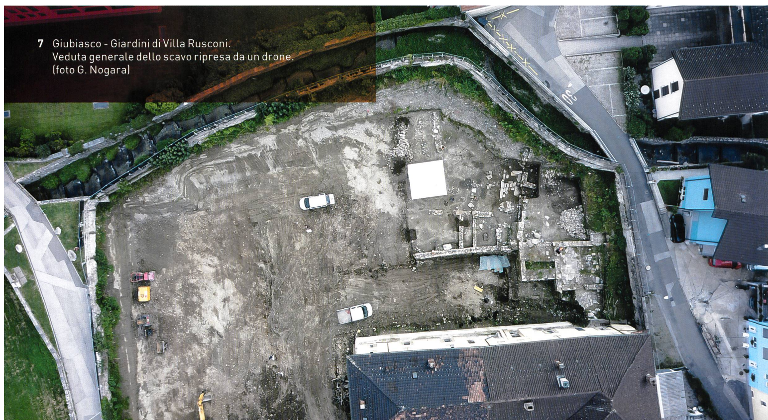
7 Giubiasco - Giardini di Villa Rusconi. Veduta generale dello scavo ripresa da un drone.

Un muro nord-sud conservato su una lunghezza di circa 13 m costituisce il limite ovest di una grande corte situata sul lato settentrionale all'edificio descritto sopra. Lo stabile e la sua corte si affacciavano sulla strada o mulattiera della quale alcune tratte ancora visibili sono inserite nell'inventario delle vie di