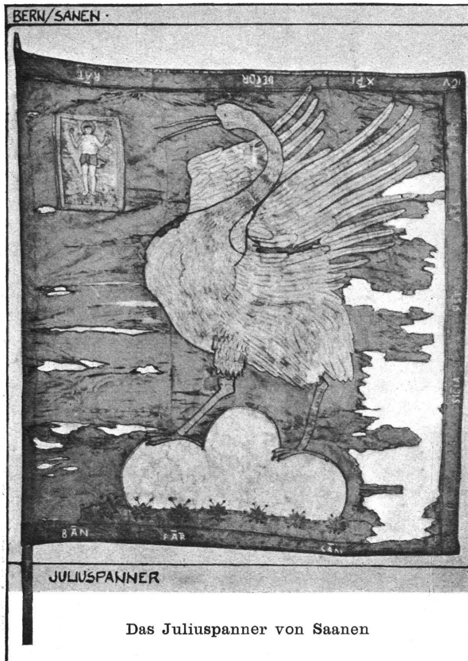
Das Juliuspanner von Saanen

Stückes der Leidensgeschichte Christi in Gestalt einer Stickerei im rechten Obereck (im Tuch bei der Stangenspitze).