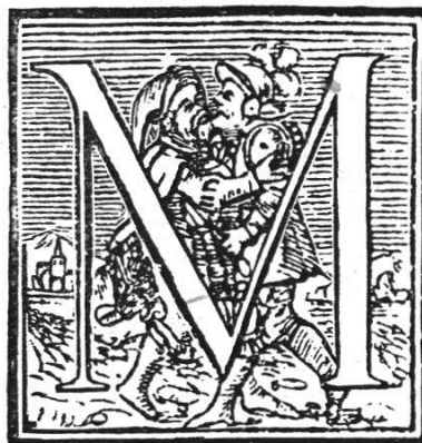
Initialen aus dem „Plutarch“, 1571 von Jean Le Preux gedruckt