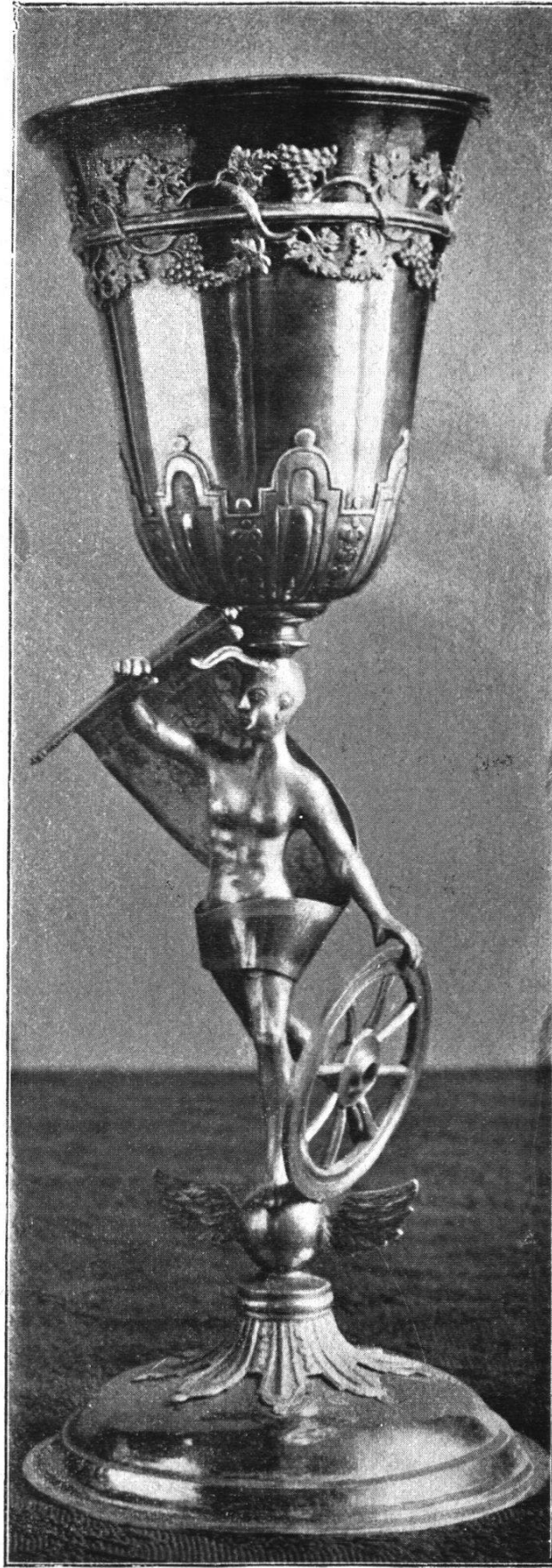
Pokal von J. U. Fechter II (Besitz der Zunft zu Pfistern)