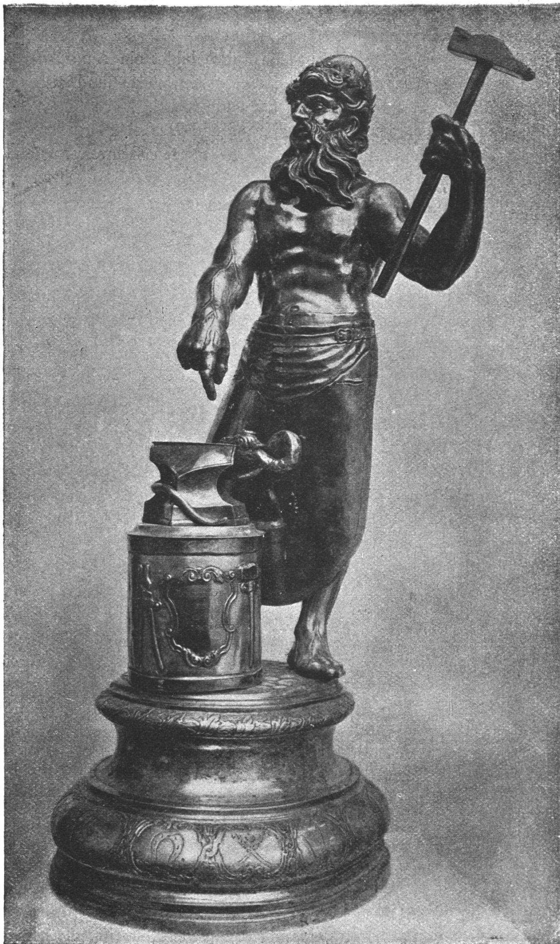
Vulkan von Johann Ulrich Fechter II (Eigentum der Gesellschaft zu Schmieden)