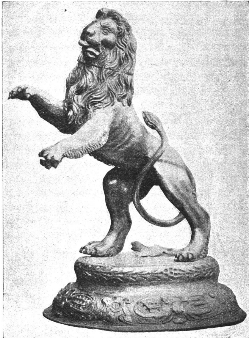
Löwe von Sebastian Fechter I (Eigentum der Gesellschaft zu Mittellöwen)

goldete, sieben Schalen, sechs Kerzenstöcke, Messer, Gabeln, Salzgefäße usw., meist mit dem Namen ihrer Donatoren aus dem XVII. Jahrhundert. 1) Vergabt wurden derartige Prunkstücke von Zunftgenossen bei Aufnahme ins Zunftrecht oder bei Anlass der Erwählung zu hohen und