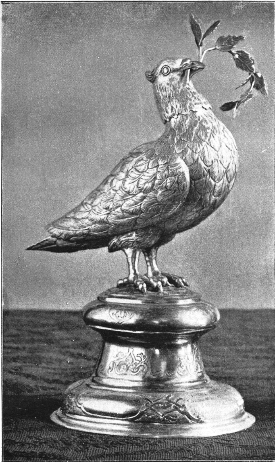
Taube mit Oelblatt von J. U. Fechter II (Besitz der Zunft zu Pfistern)