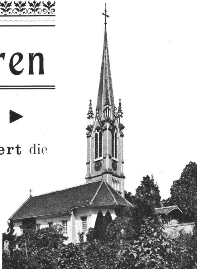
Turmuhr Muri, renoviert 1903.