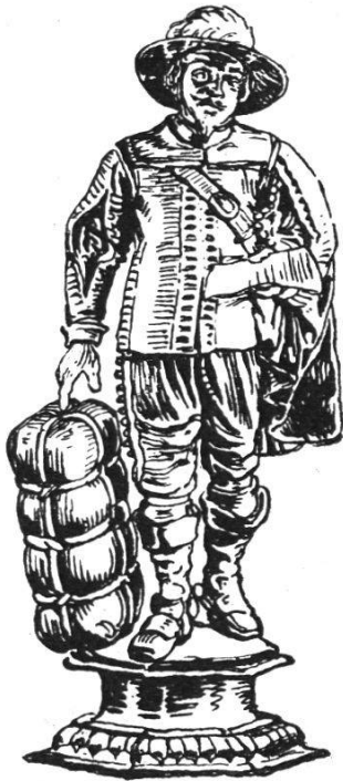
Becher der Kaufleute von 1699

Die ihnen 1676 auferlegte Last der Armen- und Vormundschaftspflege hat die bernischen Gesellschaften bis jetzt vor dem Fluch der Nutzlosigkeit bewahrt, dem längst ihre ältern Schwestern in Zürich und Basel anheimgefallen sind.