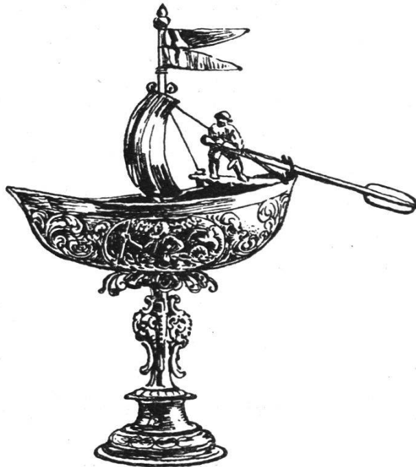
Becher der Schiffeute um 1690

Seit 1888 war der sich neu einkaufende Bürger nicht mehr verpflichtet, neben seinem Bürgerrecht auch noch eine