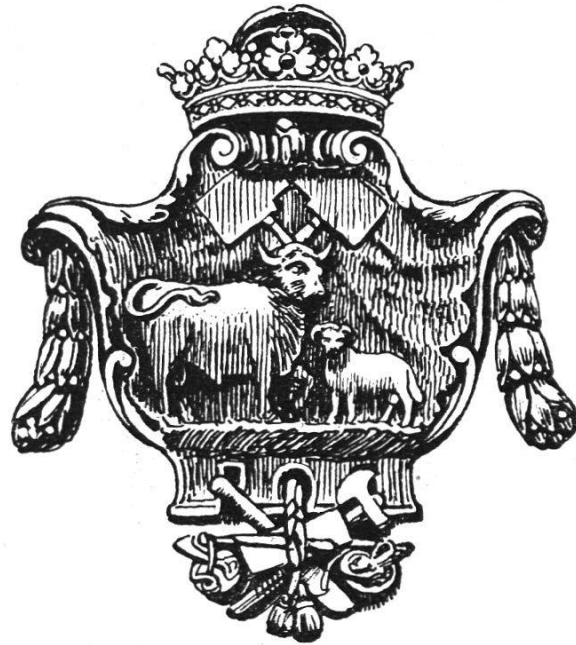
Hauswappen der Metzger

welche damals mit dem Tod ihres letzten Stubengesells erlosch, und bis 1621 gehörte die Gesellschaft zu den Schützen