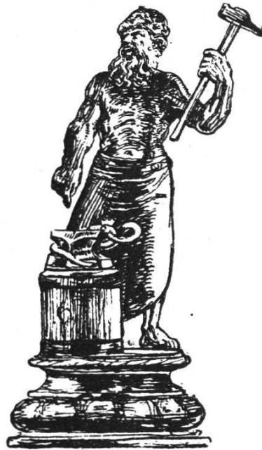
Becher der Schmiede von 1726

sellschaften zu den Webern, Schuhmachern, zum Mohren, zu den Kaufleuten, zum Affen, zu den Zimmer- und den Schifflenten. Nicht immer aber war diese Zahl gleich, sondern es gab bis 1729 noch eine Gesellschaft zu den Rebleuten,