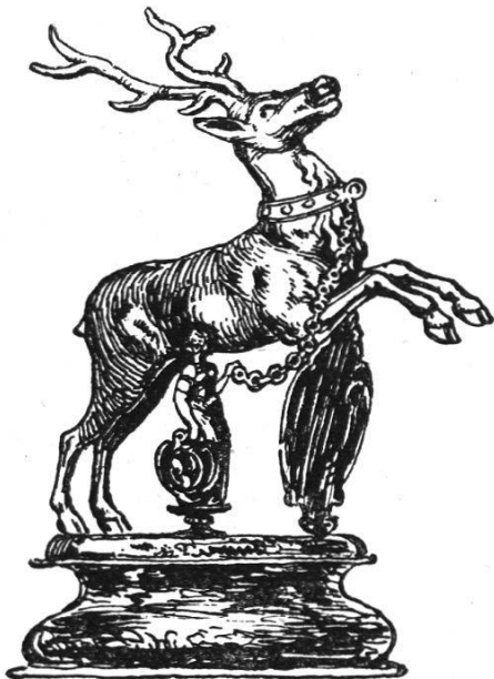
Becher der Pfister um 1700