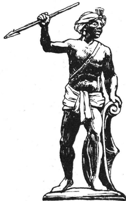
Hauszeichen der Schneider (zum Mohren)

Burgunderkriege zählen im ganzen 17 Gesellschaften auf, und um 1420, als es auch noch zwei getrennte adlige Stuben zum Narren und zum Distelzwang gab, zerfiel die Burgerschaft in nicht weniger als einundzwanzig Gesellschaften oder Stuben.