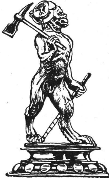
Becher der Steinmetzen (zum Affen) von 1689