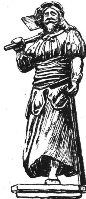
Hauszeichen der Zimmerleute

In bezug auf Armenpflege und Vormundschaftswesen bildet denn auch heute die Burgerschaft keine Einheit, sondern zerfällt in 13 Gemeinden oder Unterabteilungen, eben die Gesellschaften. Die genaue Besorgung dieser ihrer Obliegenheiten hat bewirkt, dass die bernische Bürgergemeinde bis zur Stunde dem Heimatgrundsatz für die Armenpflege huldigt und dass sogar das neue Zivilgesetzbuch in Anerkennung der zweifellosen Verdienste entgegen seiner sonstigen Tendenz eine Ausnahme, d. h. die Beibehaltung des alten Zustandes gestattet hat. Lange Zeit war diese Armenpflege für die Gesellschaften eine wahre Last, heute ist sie ihnen zum Segen geworden und hat ihnen so recht das Leben oder besser gesagt das Recht zu leben gerettet.