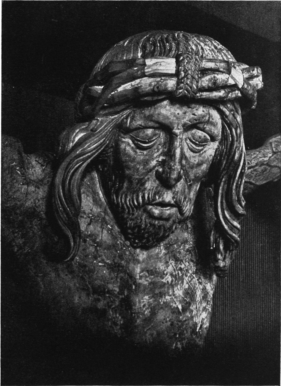
Crucifixus im Berner Historischen Museum.