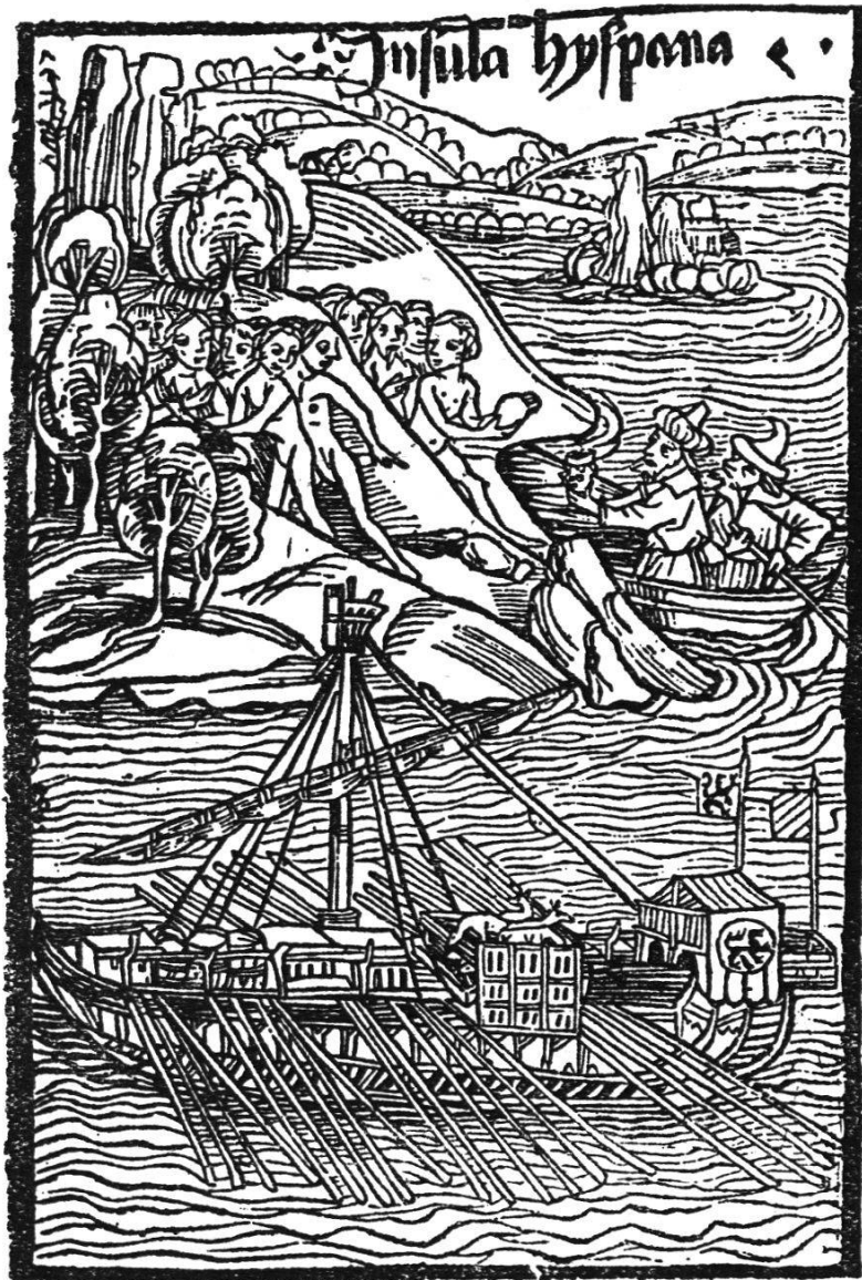
Kolumbus landet auf der Insel Hispana. Basler Druck 1494.