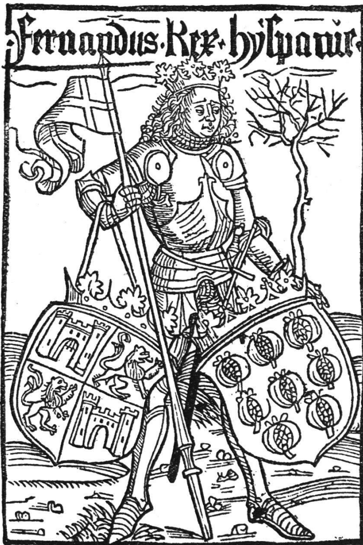
Titelseite aus dem Basler Druck von 1494 mit dem Brief des Kolumbus über die Entdeckung Amerikas (Stadtbibl. Bern, Inc. III 84).