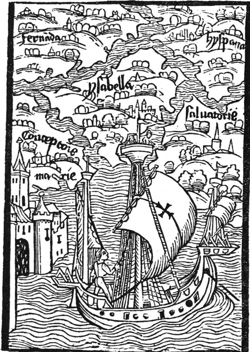
Ansicht der Inseln die Kolumbus auf seiner ersten Entdeckungsreise aufsuchte. Basler Druck 1494.

num copia salubritate admixta bominū : quæ nisi quis viderit: credulitatem superat . Huius arbores pascua & fructus / multū ab illis Iohanę differūt . Hæc præterea Hispana diuerso aromatis genere / auro metallisq̃ abundat. cuius quidem & omnium aliarum quas ego vidi : & quarum cognitionem baheo incolę vtriusq̃ sexus : nudī semp̃ incedunt :