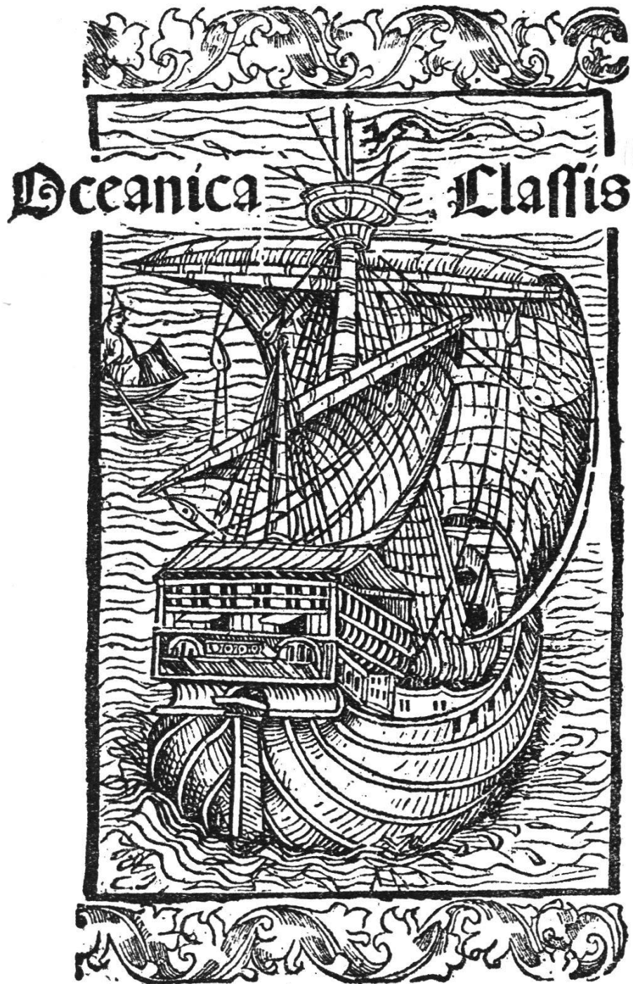
Schlußseite des Basler Druckes von 1494 mit dem Briefe des Kolumbus.