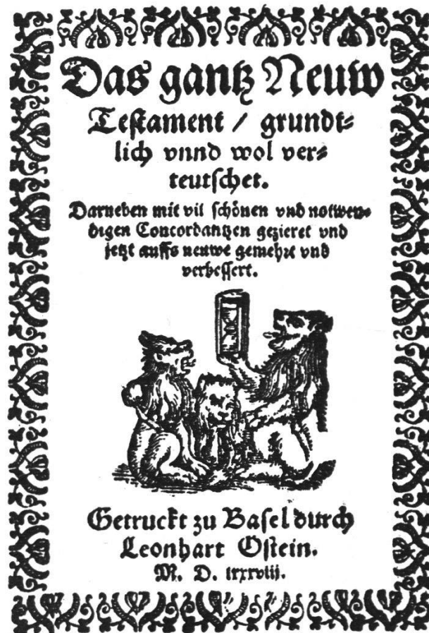
Titelblatt des ältesten bekannten Täuferbible. Nachdruck der Froschauer Ausgabe von 1533.

Hochschulbibliothek. Dieses Büchlein hat auch einem seiner frühern Besitzer Rätsel aufgegeben. Er schrieb auf das Vorsetzblatt: „Wie sich diese Ausgabe, in der im Grunde Luthers Uebersetzung befindlich, durch den durch und durch herrschenden Schweitzer Dialekt auszeichnet, so auch durch ihre