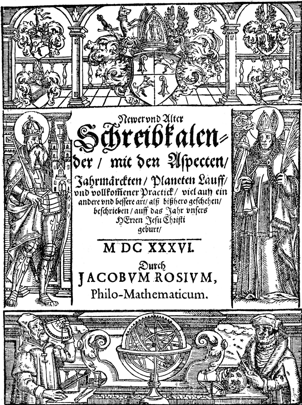
Titelbild des Schreibkalenders vom Jahre 1636.