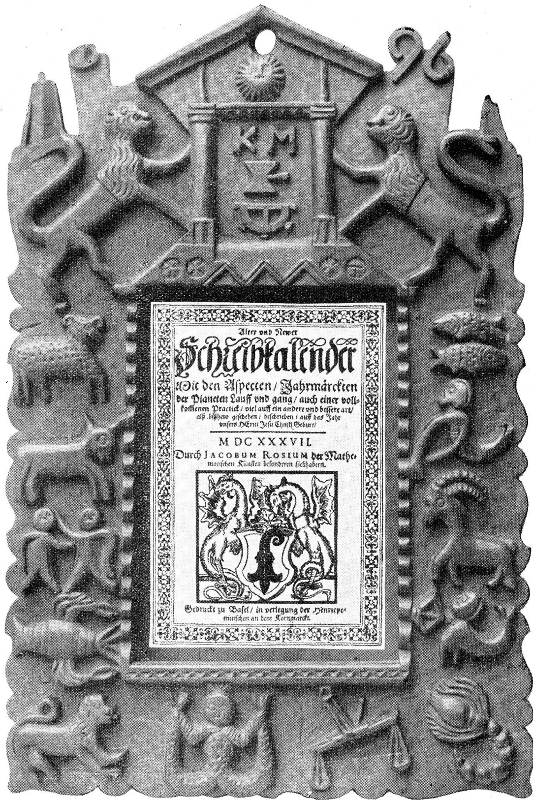
Kalenderrahmen aus dem historischen Museum in Basel.