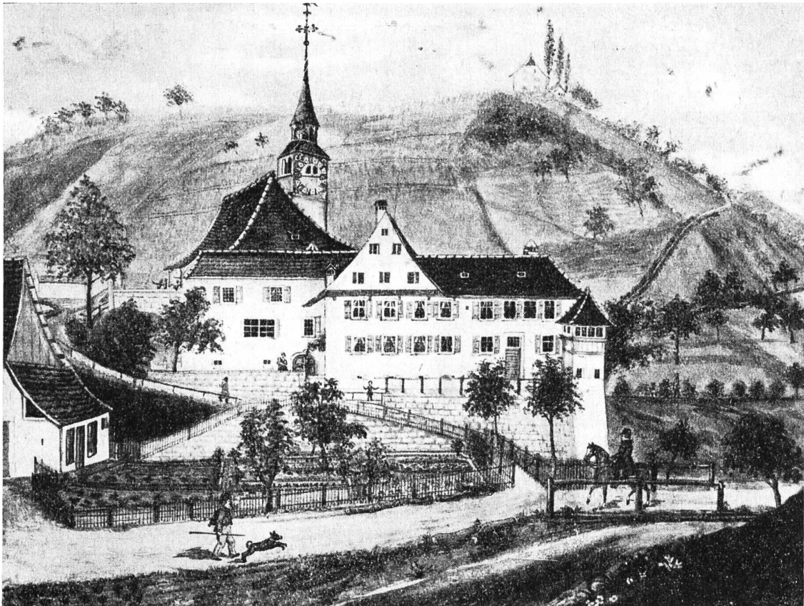
Kirche und Pfarrhaus zu Bubendorf, 1848.

Tafel zum Uhren Circel, daran man die Stunden malt» 10 Pfund, der Maler «die Uhr samt dem Compass zu malen» 13 Pfund. 11) Im folgenden Jahre wurden dem Uhrenmacher noch einmal 39 Pfund gegeben «von der Zittglocken zu machen» und im Jahre 1578 noch einmal 6 Pfund 3 Schilling «vom vnruw Rad vnd anderem an der Uhr zu verbessern.» 1575 wurden Tücher «vber des Herrn Tisch vnd tauffstein» angeschafft, 1578 ein Fusschemel «by des Herrn tisch» und ein «Stul bim thouffstein.» 12) 1583 schenkte der neue Pfarrer Heinrich Strübin ebenso wie in Ziefen, der Kirche zum Andenken an seinen Oheim