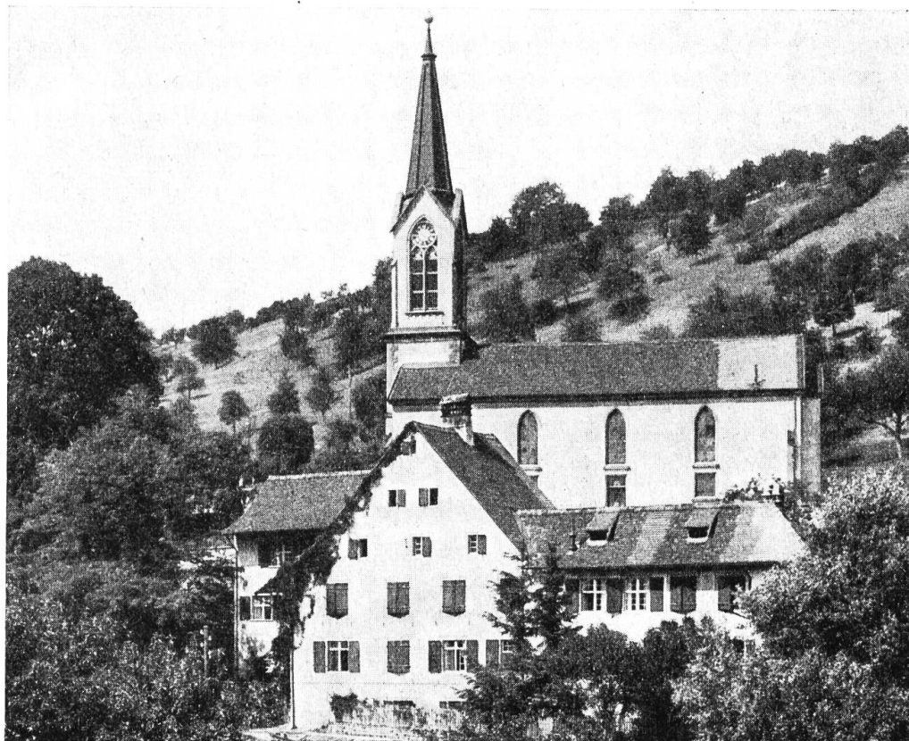
Kirche und Pfarrhaus zu Bubendorf.

angeordnet. 36) Ein geringfügiges Ereignis half mit, die Angelegenheit zu beschleunigen, ja auf ein ganz anderes Geleise zu schieben. Im Sommer 1878 sprang die grössere Glocke, so dass sie unbrauchbar wurde. Die Verwaltung erklärte sich sofort bereit, die üblichen Umgusskosten zu übernehmen oder bei der Anschaffung eines harmonischen Geläutes in der üblichen Weise beizutragen. Nun aber regte sich in der Gemeinde der Wunsch, bei Anlass der Anschaffung eines neuen Geläutes den Turm um 10 Fuss zu erhöhen. Der Bauinspektor erklärte sich mit dem Plane nach beigelegter Zeichnung einverstanden und zwar so, dass