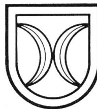
Bild 5. Wappen von Ramlinsburg. Zeichnung Alb. Zehntner, Gelterkinden.

Wappen: In Gold mit rotem Schildrand zwei abgekehrte blaue Sichel. Nach einer andern Version werden letztere als Halbmonde gedeutet. Auf Vorschlag von E. Maag, Lehrer in Ramlinsburg wurde durch die Subkommission für Gemeindewappen das Wappen der 1483 ausgestorbenen Basler Bürgergeschlechtes Sevogel der Gemeinde Ramlinsburg zuerkannt. Ramlinsburg zeigte sein Wappen erstmals öffentlich an der Höhenstrasse der Landesausstellung 1939.