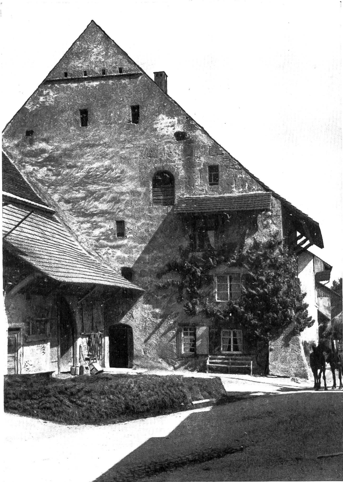
Das «Grosse Haus» in Oltingen von Süden. Typus des dreisässigen Steinhauses mit überhöhtem Wohnteil und zurückstehendem Wirtschaftsgebäude. Eingang giebelseitig. 1613 erstmals in einem Güterverzeichnis genannt, Inhaber: Baschi und Daniel Gisin. In den Entwürfen des Geometers G. F. Meyer (1679) noch sechsteilige, gotische Fensterreihe auf der Traufseite, Mauerpfeiler damals bereits vorhanden. Klebdach auf der Giebelseite 1942 abgestürzt, soll mit Subvention der staatlichen Heimatschutzkommission wieder stilgemäss ersetzt werden. Gewaltige Ausmaße des Wohnhauses: Grundriss 12,75 m lang, 19,30 m breit, Firsthöhe 18,80 m!