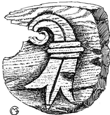
© Schild mit Baselstab aus einem alten, eichenen Türsturz in der vorderen Stube des Erdgeschosses.

Da stehen wir auf einmal in den Zeiten der alten Landvogtsherrlichkeit. Wohl in dieselbe Zeit zurück führt uns ein sorgfältig zusammengeflacktes Brettchen, das von den beiden Bewohnerinnen anlässlich der Entfernung einer heute überflüssigen Türe gegen die Nachbarstube