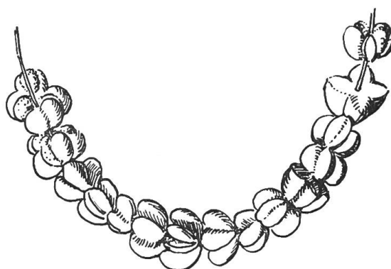
Halskette aus «Chrallebeeri» (Pfaffenhütlein). Aus Müller G., Unsere einheimische Pflanzenwelt im Dienste des kindlichen Spieles. Baselbieter Heimatbuch, Band I, 1942.

Ein weiterer Grund, sich näher mit dem Pfaffechäppli zu befassen, war die Wahrnehmung, dass das Holz auch in verschiedenen Zweigen