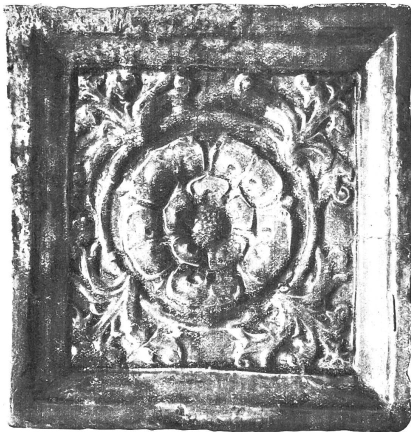
Grünglasierte Ofenkacheln aus dem Bauschutt der Schauenburg. Reichswappen mit Doppeladler, Engeln als Schildhalter, Reichskrone. — Rosenmotiv. — Zweite Hälfte 15. Jahrhundert.