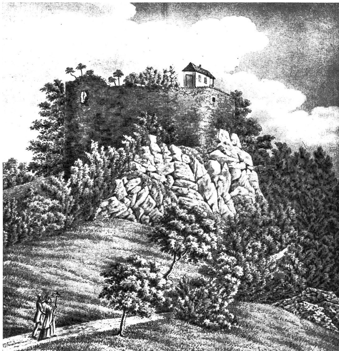
Ruine Schauenburg , Aquarell von C. Oppermann 1868. Privatbesitz. Nach M. Lutz (1814) «auf der Ruine vor wenigen Jahren ein kleines Belvedere erbaut worden, von welchem man ein lachendes Amphitheater von Ebenen, Hügeln, angebauten und waldigen Bergen diess- und jenseits des Rheines sich ausbreiten sieht...»

nem in Vergleich zu ziehen weiss. Unter den tabellarischen Beigaben interessiert vor allem die ausführliche Besitzerchronik der Schauenburg und die Offenburgische Deszendenz. Neben zahlreichen Büchelzeichnungen, worunter zwei Panoramatafeln von der Schauenburger Fluh aus und zwei Gvasche von Pratteln, sind im Illustrationsteil u. a. noch hervorzuheben die Grundrisse und Schnitte der Burg, sowie Photos von gefundenen Ofenkacheln und eines Modells. E. St.