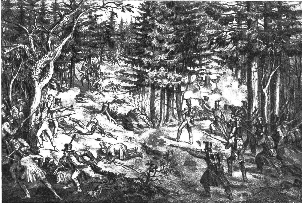
Treffen auf dem Gütsch bei Luzern am Morgen des 1. April 1845. Nach einer Lithographie der Stadt- und Hochschulbibliothek Bern. Aus «Baselbieter Heimatbuch», Band III.

gefährte, von unserer nunmehr total isolierten und verlorenen Stellung unterrichtet, hatte es daher in seiner Pflicht und Aufgabe erachtet, nicht mit der fliehenden Kolonne von Hellbühl abzuziehen, sondern vielmehr zu uns herunter zu kommen und uns, von der misslichen Sachlage genaue Kenntnis gebend, ebenfalls zum schnellen Rückzug aus unserer somit rein erfolglosen Stellung aufzufordern. So gut und edel dies von unserm Freund gemeint und gehandelt war, so war es uns dagegen trotz den in dieser unheilvollen Nacht bereits gemachten eigenen Erfahrungen dennoch nicht möglich, an die indessen bereits vollzogene Auflösung