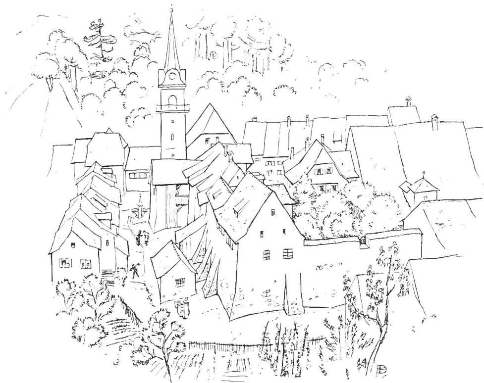
Bild 4. Partie aus dem Uhrmacherstädtchen Waldenburg.

schen ins Waldenburgertal, 25 aus Liestal, je einer aus Lausen, Giebenach und Augst, drei aus Arisdorf und sechs aus Füllinsdorf-Frenkendorf, drei aus Lupingen. Dann aus den übrigen Ortschaften der nahegelegenen Täler: Aus Seltisberg und Ziefen und natürlich auch aus Ramlinsburg, einem Ort, der 1870 noch 100 Webstühle besass und gewerblich so stark verarmte, dass zu unserer Zeit (1948) nur noch acht Webstühle dort standen. Wirklich, die Uhrenindustrie hat eine grosse wirtschaftliche Anziehungskraft bewiesen. Es besteht