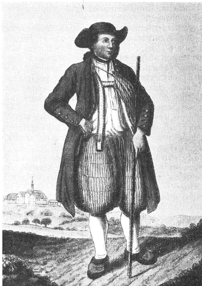
Bild 8. Bauer aus der Landschaft Basel, im Hintergrund St. Margarethen. Nach einer Zeichnung von Chr. von Mechel (1737—1817). Aus «Basel, Stadt und Land», S. 276.

Der südliche, flache Plateauteil des Parkes ist Mattland . Auf diesem wurde 1928 die Meteorologisch - Astronomische An-