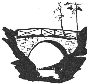
Bild 7. Teufelsbrücklein im Margarethenpark. Nach einer Federzeichnung von Peter Suter.

Von den 44 ha, die die Stadt damals erworben hat, fallen 12 ha auf den eigentlichen Park, d. h. auf das Gebiet innerhalb der Gundeldingerstrasse, Friedhofstrasse, Venusstrasse und des Unteren Batterieweges.