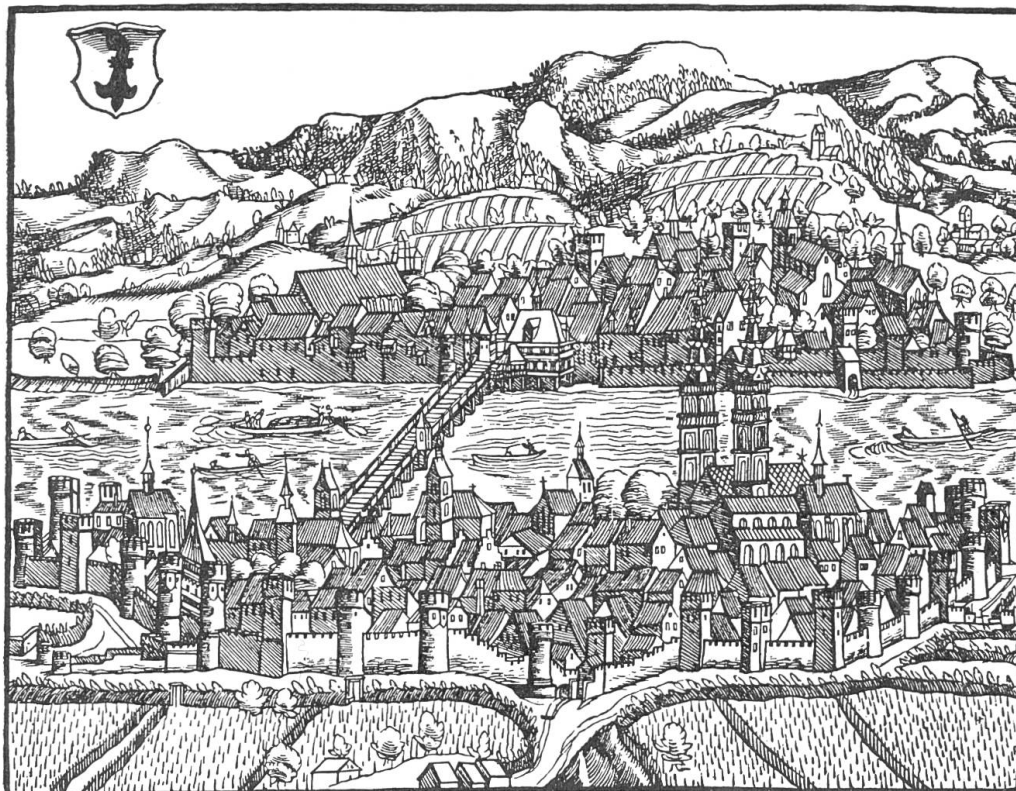
Bild 1. Basel im 16. Jahrhundert. Aus der Schweizerchronik von Johann Stumpf, 1547/48.

Basel war ursprünglich eine Bischofsstadt. Wie andere Städte — Strassburg, Worms, Köln, Mainz, Magdeburg — löste es sich Schritt für Schritt von dessen Herrschaft und wurde eine Freistadt, d. h. es genießt die Vorteile der Reichszugehörigkeit, ohne indessen selber zu Leistungen wie Heerfolge oder Steuer verpflichtet zu sein. Mannigfach sind aber die Beziehungen zu Kaiser und Reich. An den Kaiser lehnt es sich an im Kampf gegen den Bischof.