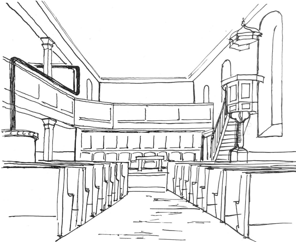
Bild 2. Kirche Buus. Blick auf den Chor, Zustand vor 1943. Nach einer Federzeichnung von Walter Blapp.

Im Chor musste der Asphaltbelag einem passendem Plattenboden weichen. Leider benützte man diese Gelegenheit nicht zu Sondiergrabungen, die zweifellos über frühere bauliche Zustände der Kirche hätten Aufschluss geben können. Die Malerarbeiten besorgte in vorbildlicher Weise Albert Zehntner in Gelterkinden. An den hölzernen Säulen und an den Unterzügen, die die Emporen und die Decke tragen, wurde der Oelfarbanstrich entfernt und überall dem Holz eine natürliche, warme Tönung gegeben; Decke und Wände erhielten