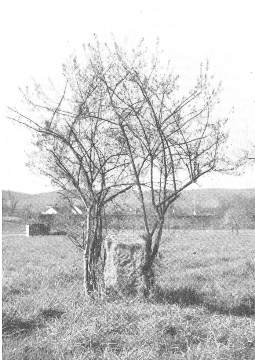
Bild 2. Wappen der Herren von Eptingen. Bannstein von Pratteln «in den Wiedenmatten» bei Augst, Ehemaliger Etterstein von 1463.

alten Reitweg nach Liestal, nach Augst an den Rhein und nach Basel hinunter, also nach fünf Richtungen. Es ist also naheliegend, dass ausserhalb der an diesen Stellen angebrachten Etertore je einer dieser vorgeschriebenen «Marchsteine» stand, ähnlich wie während des Mittelalters vor den Toren der Stadt