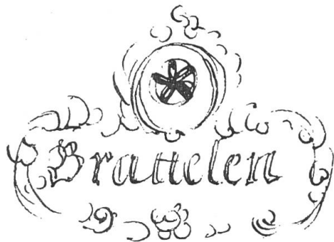
Bild 4. Vignette mit Rosette zum Grundriss von Pratteln. Zeichnung von G. F. Meyer, 1678 (Entwürfe, Band 3, S. 628 a)

Im Staatsarchiv von Liestal liegen verschiedene Akten aus dem Jahre 1642, als Beweise für die Setzung der ersten «neuzeitlichen» Grenzsteine um den grössten Teil des ganzen Pratteler Bannes. Sie haben auch den Anlass gegeben zur Anbringung eines schönen Wahrzeichens auf diesen Steinen, das ein tüchtiger, für form-schöne Arbeit einstehender Steinmetz aus-