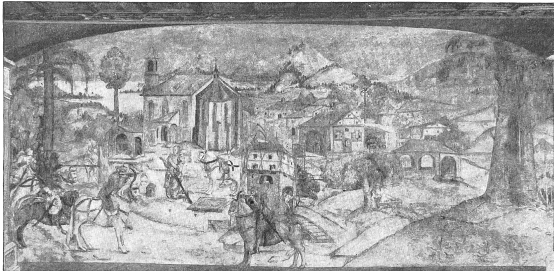
Inneres des Beinhauses: Wandgemälde mit der Legende von den dankbaren Toten. Anfang 16. Jahrhundert. Aus dem Schweiz. Kunstführer: Pfarrkirche Muttensz, von E. Murbach.

Wie wir gesehen haben, vermag die restaurierte Kapelle uns heutigen Menschen trotz den veränderten Anschauungen und Verhältnissen noch recht viel