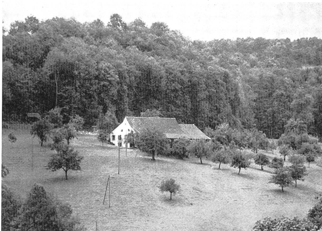
Bild 2. Hof Gstad, wie er von der Nordseite des schmalen Waldstreifens in nordwestlicher Richtung zu sehen ist.

wurzelt. Solche Haufen finden sich öfters an Wald- oder Besitzergrenzen. Vor 35 Jahren war der Streifen nur mit kleinem Gestrüpp bewachsen, das die Aussicht über das Tal kaum hinderte. Ein einziger Waldbaum, eine grosse Birke 2 , stand damals nahe beim untern Ende der Steimerte. Dieser Baum fiel mir auf, weil seine Aeste gestutzt und dicht mit dünnen, herabhängenden Zweigen besetzt waren. Die Birke musste eben Material für Birkenbesen liefern! Ein ähnliches Exemplar stand auf «Feld», am alten Strässchen nach Titterten. Dieses wurde im Frühling oft angebohrt, um den wohlschmeckenden, reichlich fließenden Birkensaft zu gewinnen.