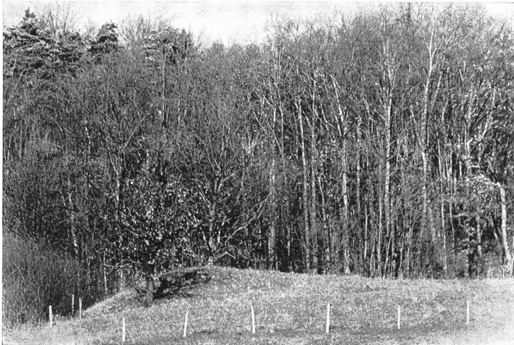
Bild 1. Sandhügel im Bergli.

Der Hof Gstad liegt auf der linken Talseite des Reigoldswiler Tales. Er teilt seine Lage mit den Höfen Niestelen und Eichen, liegt aber eine Geländestufe tiefer, aber immer noch 80 m über der Talsohle. Der Name weist eher auf ein Gelände an einem Fluss oder an einem See hin und man wundert sich nicht wenig, wie er entstanden ist. Für mich drängte sich eine Erklärung auf, als ich