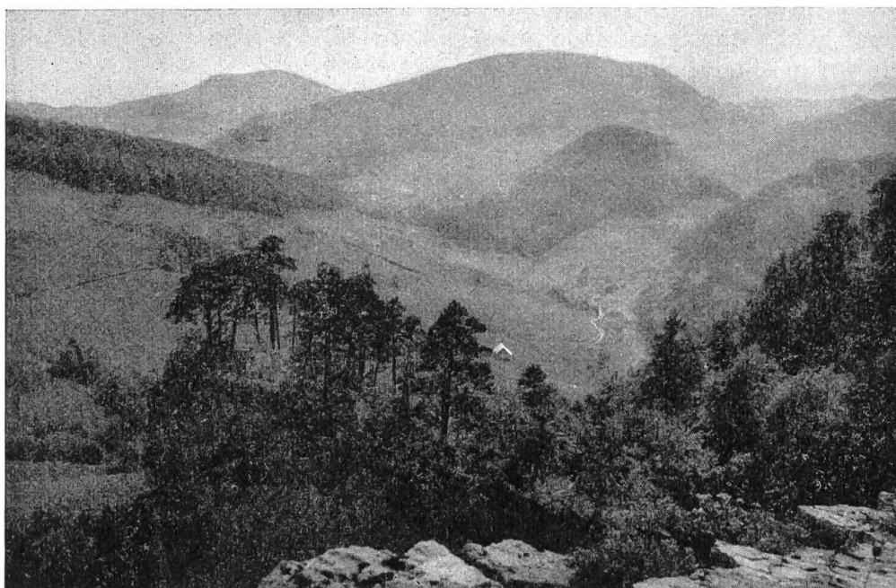
Bild 4. Blick von der Ankenballen in das Tal des Chilchzimmerbaches. Im Hintergrund Chräiegg und Bereten.

Er kämpfte aber auch für eine Bahnverbindung. Als 1858 die Hauensteinstrasse von Tag zu Tag mehr verödete, trat er in einer Sitzung für den Bau einer Pferdebahn von Liestal nach Langenbruck ein, allerwenigstens bis Waldenburg, gab aber diesen Plan bald zugunsten einer Dampfbahn auf, welche die Zentralbahn als Ersatz für den verlorenen Durchgangsverkehr auf der