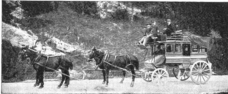
Bild 6. Die alte Langenbrucker Post.