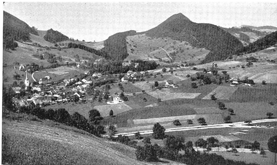
Bild 5. Langenbruck gegen Westen. Im Hintergrund die Höhenzüge von Bereten, Breitenhöchi bis Helfenberg und Vorderi Egg.

zweckmässige Einrichtungen vorhanden waren. In dem 1874 erbauten Kurhaus wurde sodann alles eingerichtet, was damals modern war. «Von hölzernen Badewannen ist beinahe gänzlich Umgang genommen worden, weil dabei die minutiöse Reinlichkeit nicht gehandhabt werden kann, wie es wünschbar ist. Die meisten Wannen sind aus poliertem Zinkblech getrieben, diejenigen für Sole-, Schwefel- oder Mutterlaugebäder bestehen aus emailliertem Gusseisen. Einzig das Wellenbad und die Regen- und Strahlduschen bestehen aus Fichtenholz». Die Badekabinette waren bequem eingerichtet und enthielten, wie der Arzt erklärte, alles was zu einem soliden Komfort gehörte 14 .