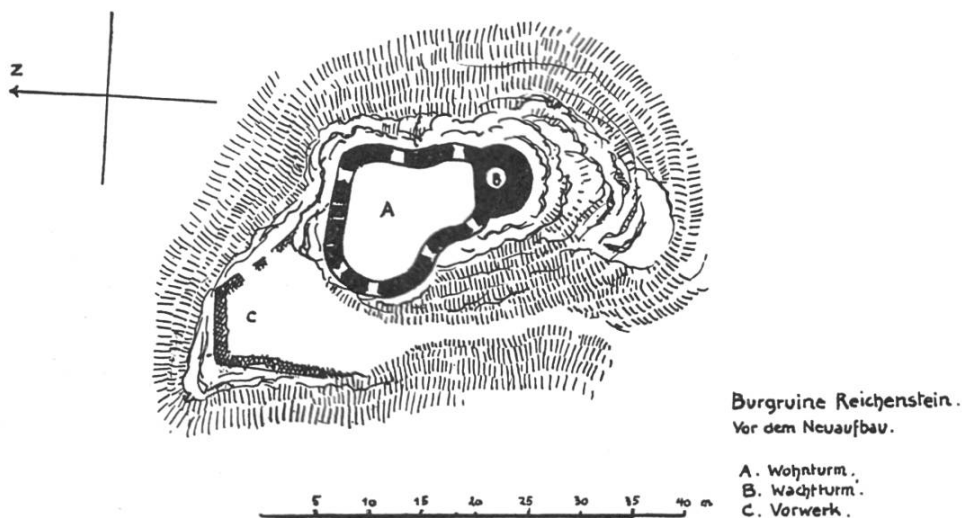
Bild 2. Grundriss des Reichensteins. Nach einer Skizze von C. A. Müller.

Lehen im mittelalterlich-feudalrechtlichen Sinn wurden nicht etwa gegen Zins verliehen. Sie haben mit heutigen Pachtverhältnissen nichts zu tun. Der Bischof als eigentlicher Herr der Burg und Herrschaft Reichenstein gab diese der Ritterfamilie Reich als Entschädigung für deren Dienste, die sie ihm zu leisten hatte. Verteidigung dieser Wehranlage und deren Unterhalt, Waffendienst für das Bistum im allgemeinen waren die Pflichten der Lehensträger.