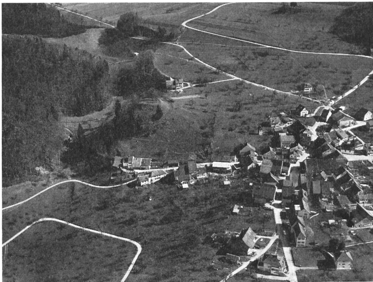
Titterten, von Nordwesten Landeskarte 1 : 25 000, Blatt 1088

Nr. 477 Aufnahmedatum: 15. 4. 1964, 15.30 Uhr