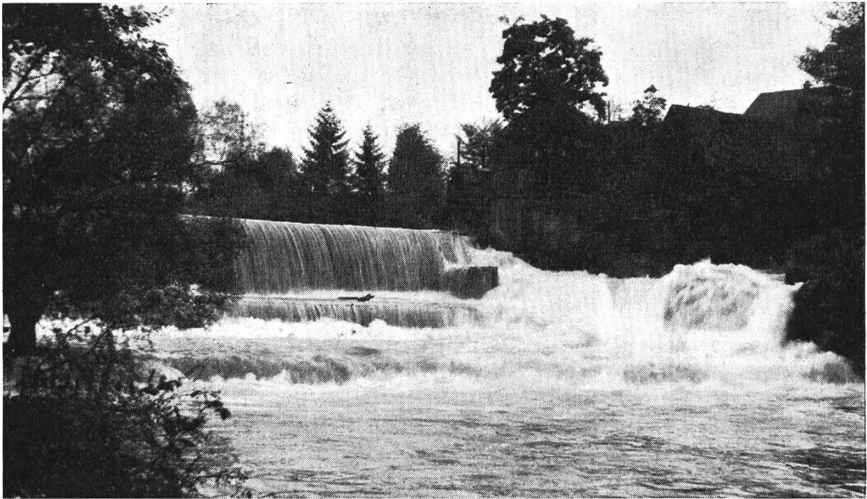
Bild 3. Der Birsfall bei Neuwelt-Münchenstein. Im Hintergrund rechts das «Wasserhaus», ursprünglich Wohnung des Schleusenwärters. Aufnahme am 26. Sept. 1968 durch Peter Suter.

graben und von der Grundweid weitere Zuflüsse auf und mündet weiter unten in die Talaue des Grindel. Der Rünenberger Giessen besteht aus zwei Felsabstürzen, die 100 m auseinanderliegen; der obere (ca. 520 m ü. M.) ist der imposantere (Bild 2). Der Zegliger Giessen befindet sich 1,75 km östlich auf fast gleicher Meerhöhe (515 m ü. M.); er überwindet wohl die gleiche geologische Kalkschicht der flach liegenden Tafeljuraplatte. Der prächtige, nahezu unbekannte Rünenberger Giessen kann auf einem Fussweg vom Grindel her erreicht werden. Auf dem unzugänglichen Felsplateau zwischen Stieren- und Hundsbrunngraben befindet sich das Refugium «Alt Schloss», worüber in unserer Zeitschrift früher berichtet worden ist 5 .