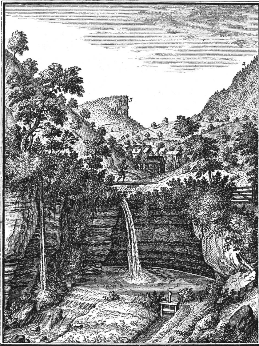
Bild 1. Der Giessen bei Zeglingen. 1 Zeglingen, 2 östlicher Abhang des Wisenberges, 3 Wisenflue. Nach einem Kupferstich, entworfen von Em. Büchel, gestochen von J. R. Holz- halb, in D. Bruckners Merkwürdigkeiten, Basel 1757.

tigem Geräusch herab und wässert das ganze Tecknauer Thal bis naher Gelterkinden. Das unter dem Giessen liegende Thal, so das fruchtbarste Wiesengelände, ist von reizender Schönheit und Anmuth.» Nach dem Kupferstiche Em. Büchels (Bild 1) bildete schon im 18. Jh. der Bach eine Gumpe, dort nahm ein Wassergraben seinen Anfang. Spuren dieser Bewässerungsanlage sind noch heute sichtbar; auch soll nach Tr. Meyer 3 der Kolk als «Ross-Schwemmi» benützt worden sein. An Sonntagen tummelten sich daselbst die Burschen der umliegenden Dörfer mit ihren Pferden.