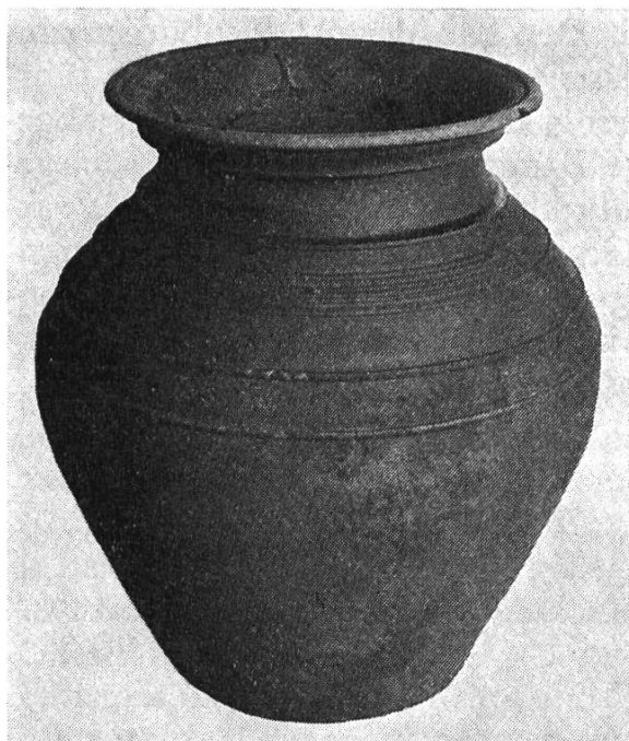
Bild 1. Schalltopf aus der Kirche Gelterkinden.

chen des 15. Jahrhunderts, Schalltöpfe gefunden worden sind. So z. B. in der Kirche zu Oltingen, in der Basler Barfüsserkirche, in der Johanniterkapelle zu Rheinfelden, in der abgebrochenen Kirche zu Rein bei Brugg, in der Kapelle der Heiligen Drei Könige zu Baden, um nur einige in der näheren Umgebung zu nennen. Zu diesen (zufällig ausgewählten) Beispielen kommen weiter wahrscheinlich in ganz Europa, denn eine Mitteilung von 1864 meldet bereits, dass Schalltöpfe in Deutschland, Schweden und Dänemark sowie in vielen byzantinischen Kirchen Russlands anzutreffen seien 3 .