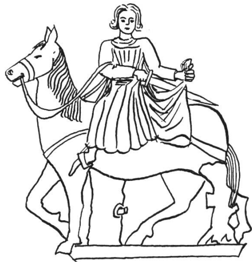
Bild 4. Reiterstatue St. Martin vom Basler Münster. Original nach 1343, heute im Münsternuseum. Kopie am Münster 1883.

Der h l. M a r t i n wurde um 316 in Sabaria in Ungarn geboren. «Mit 10 Jahren war er Katechumene, mit 15 Jahren Soldat der römischen Reiterei in Gallien. Im Alter von 18 Jahren getauft, schied er 20jährig aus dem Kriegsdienst