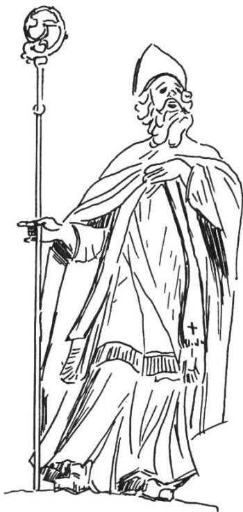
Bild 2. Statue des hl. Hilarius aus der Kirche von Holderbank SO (18. Jh.). Merkwürdigerweise haben sich von diesem in altchristlicher Zeit hoch verehrten Heiligen keine Denkmäler aus früherer Zeit erhalten. Aus Loertscher G., a.a.O. S. 84, Abb. 90.

Remigius, der heilige Bischof von Reims und der bekannte Frankenapostel, stammte aus vornehmer, gallo-römischer Familie. 437 geboren, wurde er bereits 22jährig Bischof von Reims. Eifrig um die Bekehrung der Arianer und der heidnischen Franken sich bemühend, erhielt er geschichtliche Berühmtheit durch die Unterweisung und die Taufe des fränkischen Königs Chlodwig. An die Tauffeier knüpft sich die Legende, dass bei der Spendung der Firmung das fehlende Salbfläschchen wunderbarerweise durch eine Taube