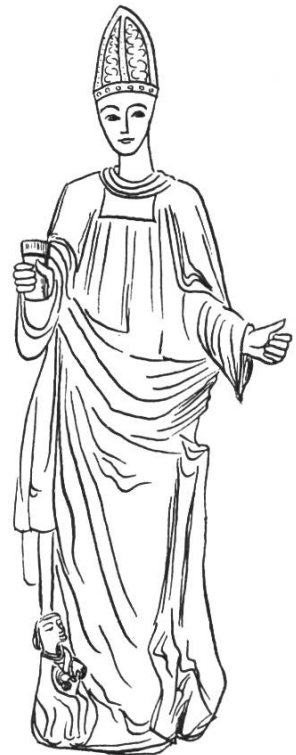
Bild 3. Statue des hl. Remigius (16. Jh.) in der Pfarrkirche von Weiler bei Rottenburg. Aus Braun J., a.a.O. S. 626, Abb. 338.

beigebracht worden sei. Remigius starb hochbetagt um 534. Durch den Einfluss der fränkischen Glaubensboten wurde die Verehrung des hl. Remigius auch in Alemannien volkstümlich. In der Diözese Reims wird der Namenstag am 13. Januar, seinem Sterbetag, gefeiert, sonst aber meistens am 1. Oktober, dem Jahrestag der Uebertragung seiner Leiche in die Krypta der Kirche des hl. Christophorus. Attribute: Bischofstracht, mit Salbfläschchen, mit Taube, welche Salbfläschchen herbeibringt, zu Füßen des Heiligen König Chlodwig 6 .