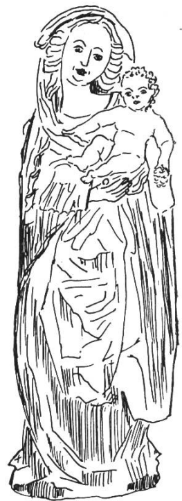
Bild 6. Statue Maria mit Kind (um 1530) aus der Pfarr- kirche Büsserach SO. Aus Loertscher G., a.a.O. S. 191, Abb. 205.

bute: Benedictiner mit Kapuze; oft ist ein Toter beigegeben (Ursus), den Fridolin nach der Legende wieder lebendig machte, damit er in einem Rechtsstreit Zeugnis ablegen konnte. Namenstag: 6. März (grosse Prozession in Säckingen).