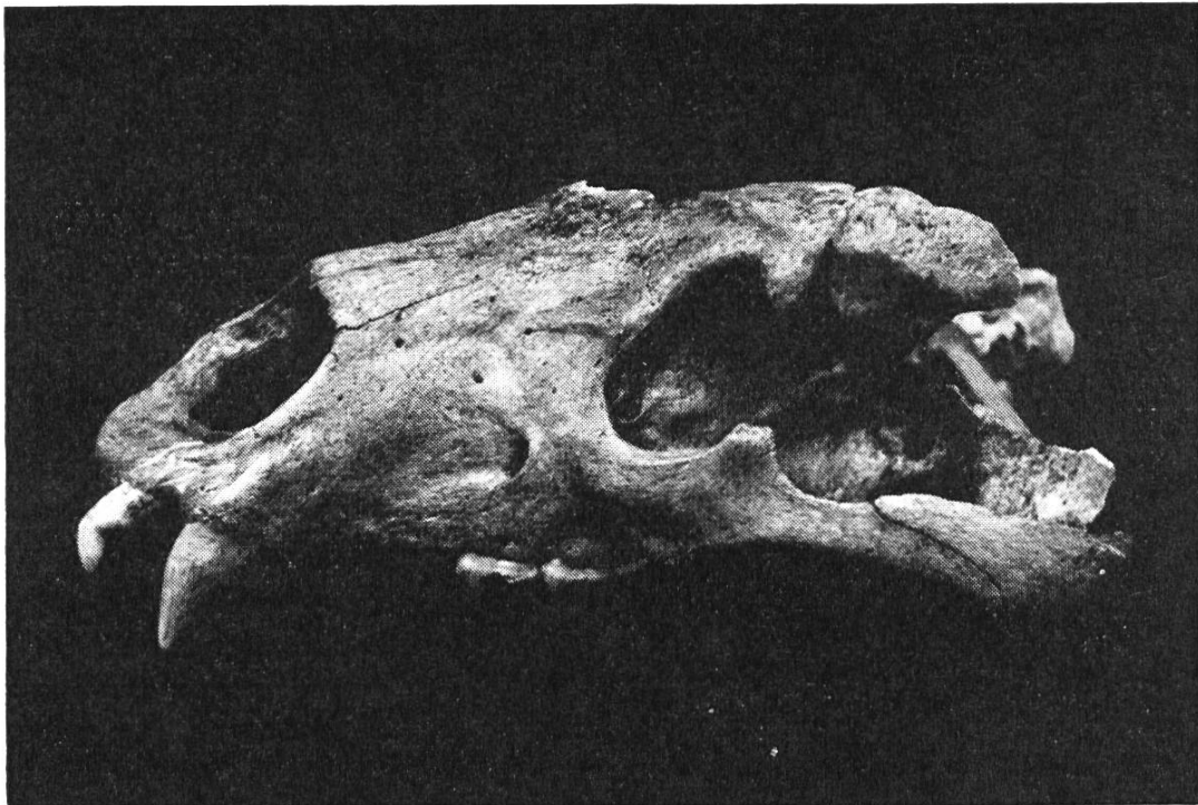
Bild 3. Schädel eines Braunbären aus dem Schelmenloch (Lauwil). Grabung von Dr. E. Roost 1962. Kantonsmuseum Baselland.

Im Jahre 1962 untersuchte eine Lehrergruppe unter Führung von Dr. E. Roost die Spalthöhle Schelmenloch am Vogelberg bei Lauwil. Nach mündlicher Ueberlieferung sollen dort die letzten Bären der Umgegend gehaust haben; auch ist die Stelle, wo der Bär von 1798 erlegt wurde, nur etwa einen Kilometer davon entfernt. Die Grabung brachte das Skelett eines mittelgrossen Braunbären zutage (Bild 3); ausserdem fanden sich Skeletteile zweier weiterer Bären und anderer Säugetiere. Der Bär war als Jagdwild begehrt, sein Fell gesucht, und die Tatzen galten als Leckerbissen. Der Schaden an Vieh war nie bedeutend, braucht der Bär doch seine Riesenkräfte vor allem, um Steine um-