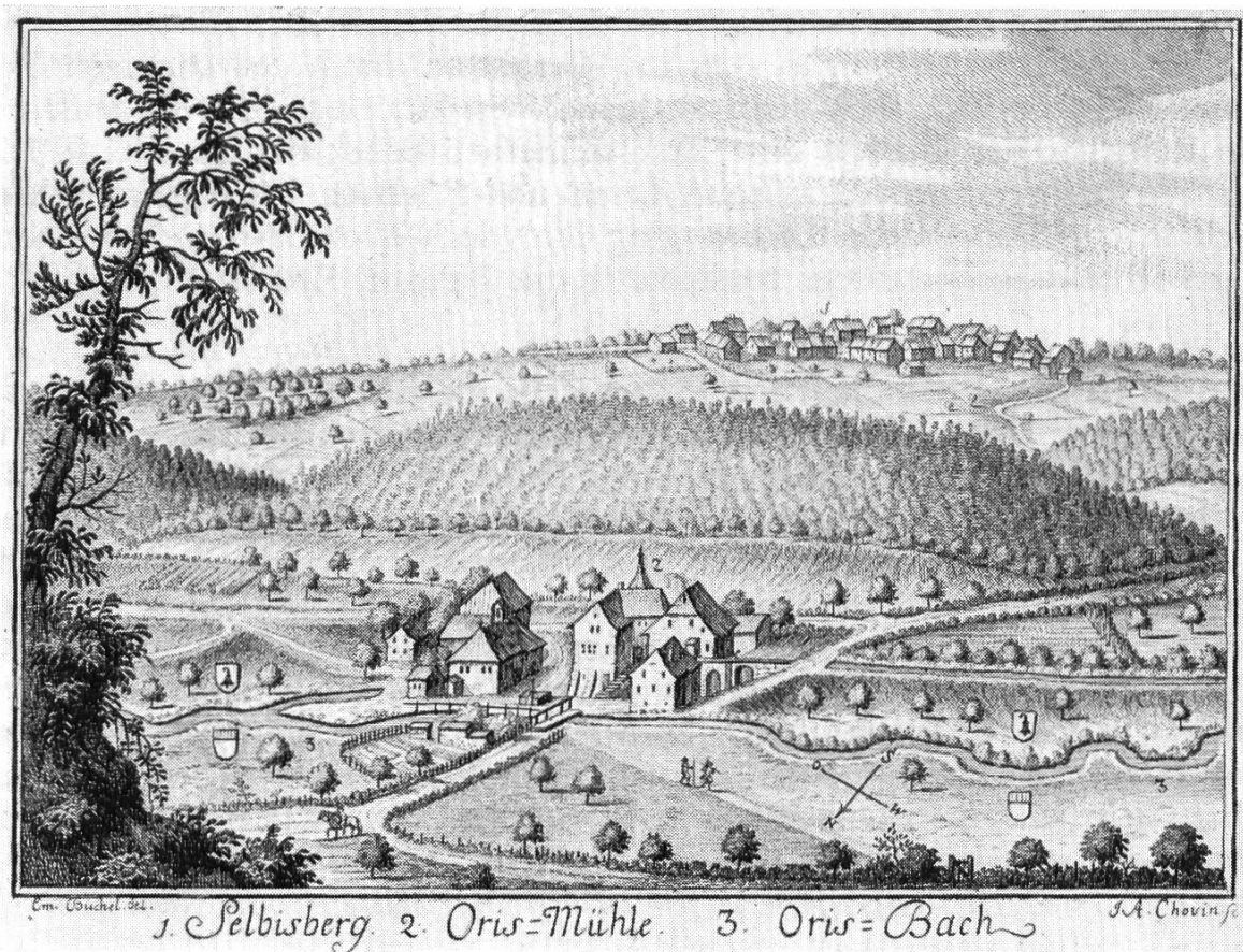
Bild 1. Orismühle mit Seltisberg, von Westen gesehen. Nach einem Kupferstich von Emanuel Büchel in Daniel Bruckners Merkwürdigkeiten der Landschaft Basel, Basel 1753. Links Sennerie, rechts Wohngebäude und Mühle, einen nach Westen offenen Hof bildend.

cher und den Katechismus lesen. Die Lehrer hatten meist selbst eine sehr dürftige Ausbildung genossen und mussten nebenbei noch einen anderen Broterwerb suchen. So befahl auch etwa der Lehrer in der Schulstube von Seltisberg beim Lesen eines der langen, zusammengesetzten Wörter, über das er selbst nicht hinauskam: Ueberhüpfet's! Darum sagte er auch, nachdem der Knabe ein Vierteljahr die Schule besucht hatte und 12 Plappart Schulgeld (etwa 1 Franken nach altem Wert) dafür bezahlt hatte, zu Vater Schäfer: «Behaltet euren Hansjoggeli nur zu Hause; er kann mehr als ich.»