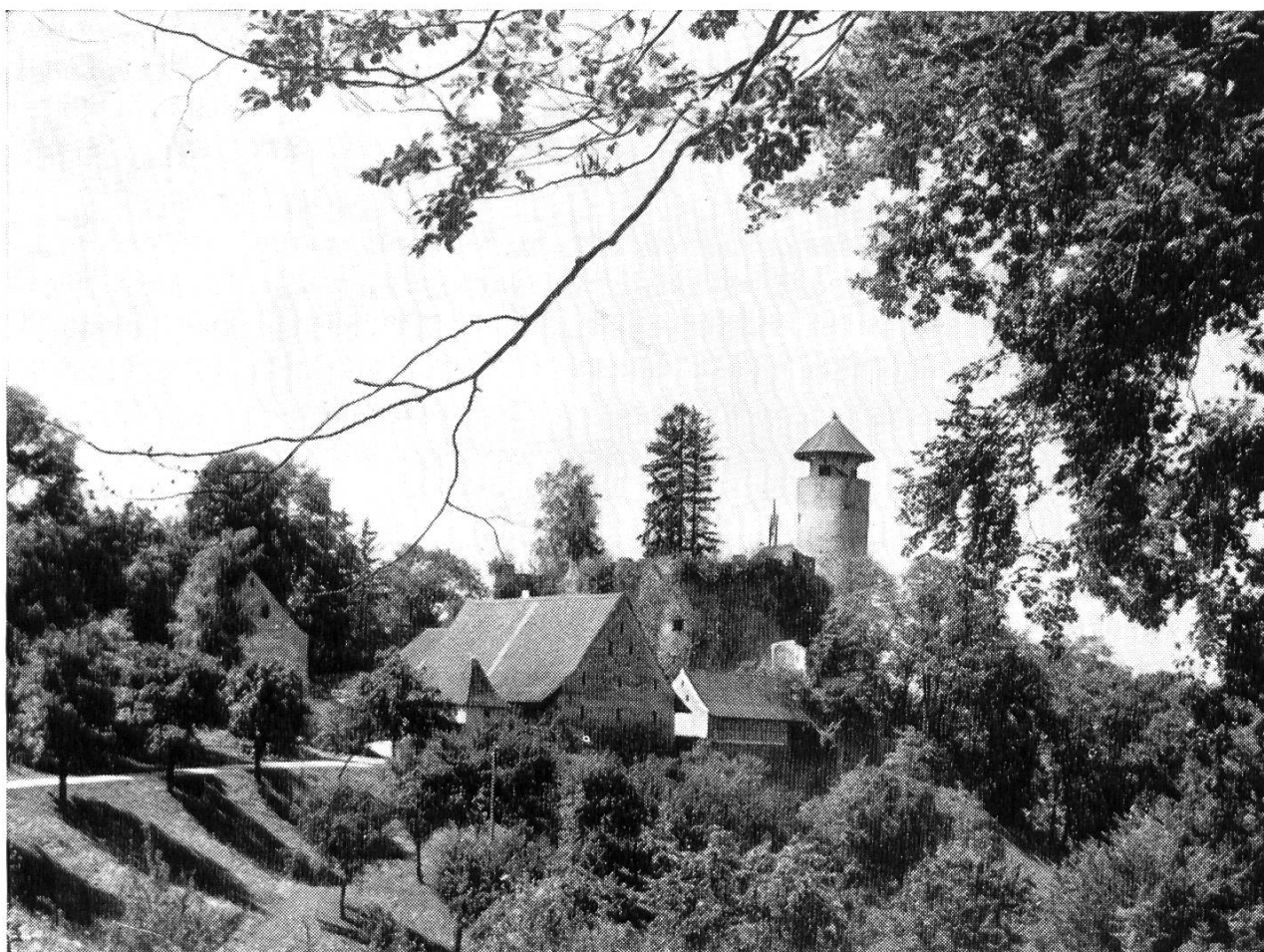
Bild 5. Weidhof oder Unterer Burghof von Osten. Auf dem Bergfried kegelförmiges Dach, darunter Rundgang, Storch als Wetterfahne.

geschlossen gewesen wäre, hätten die Angreifer dort zwischen der zuletzt genannten vorstossenden Mauer und diesem Zwingertor sich gestaut und hätten aus einem direkt über diesem schmalen Platz oben auf der Bergmauer angebrachten Gusserker mit heissem Pech, Oel oder Wasser begossen werden können. Dieser Gusserker ist ein kleiner Riegelbau und nur durch schräge Balken, nicht steinerne Konsolen, gestützt.