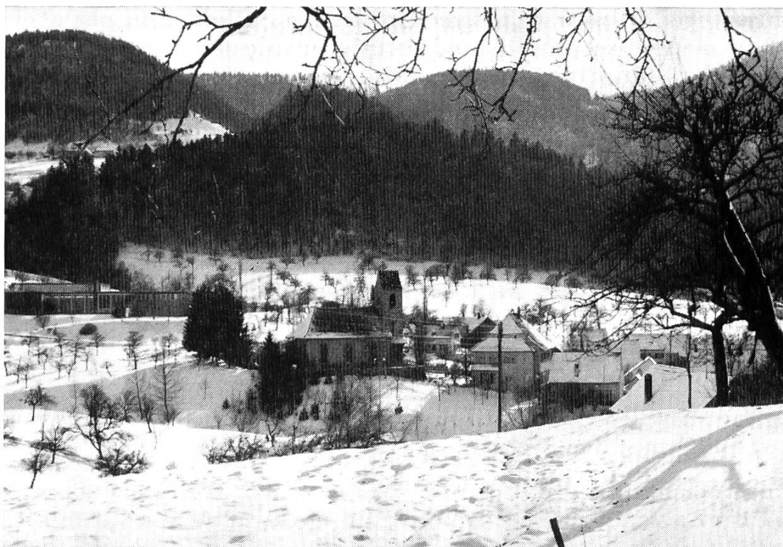
Bild 1. Blick von Norden auf das Baumgartenland. Im Hintergrund Kirche, darüber Ruine Ramstein.