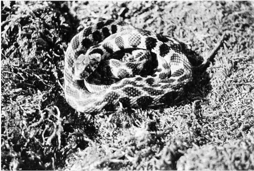
Bild 3. Weibchen der Milos-Ringelnatter ( Natrix natrix schweizeri ).

los, Polinis, Kimolos, 1934 Milos, Erimomilos, 1935 Milos, Gerakunia, 1936 Milos, 1937 Milos, Siphos, 1939—1945 Aktivdienst im 2. Weltkrieg, 1956 Griechenland, Milos, 1969 Milos.