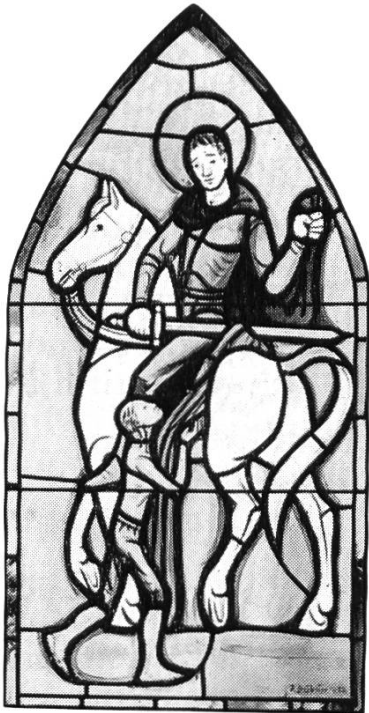
Bild 3. St. Martin, Glasscheibe von Jacques Düblin, 1952. Aus QuF 1, 1952, Seite 155.

Erhaltung des ehrwürdigen Gotteshauses St. Martin eh und je eingesetzt haben 28 . Dieses dient den monatlichen Gottesdiensten, den Hochzeiten, Beerdigungen und Vorträgen. Sein helles Geläute wird auch in der Muttergemeinde Reigoldswil im hinteren Frenkental gerne gehört, kündigt es doch Ostwind und damit auch gutes Wetter an!