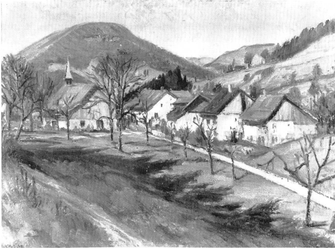
Bild 3. Bärenwil mit Wanneflue, gegen Westen. Das Haus mit dem Dachreiter Restaurant Chilchli. Nach einem Oelbild des Bärenwiler Malers Albert Schweizer (1885—1948) im Disteli-Museum Olten. Aus BHB 6, S. 77.

der über den Kirchhof führte, nach Hägendorf. Dort fing das Steigen und Ziehen erst recht an, doch langte die Ladung immer gut zu Hause an.