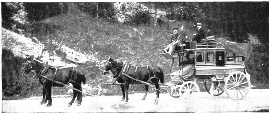
Bild 8. Die alte Langenbrucker Post um 1910. Täglich zwei Kurse von Waldenburg nach Langenbruck bis zur Einführung des Postautos (1917).