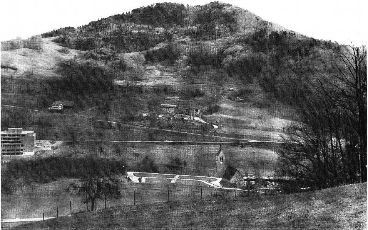
Bild 1. Kirche St. Peter, Altersheim Gritt und Nordwestseite des Dielenberges.