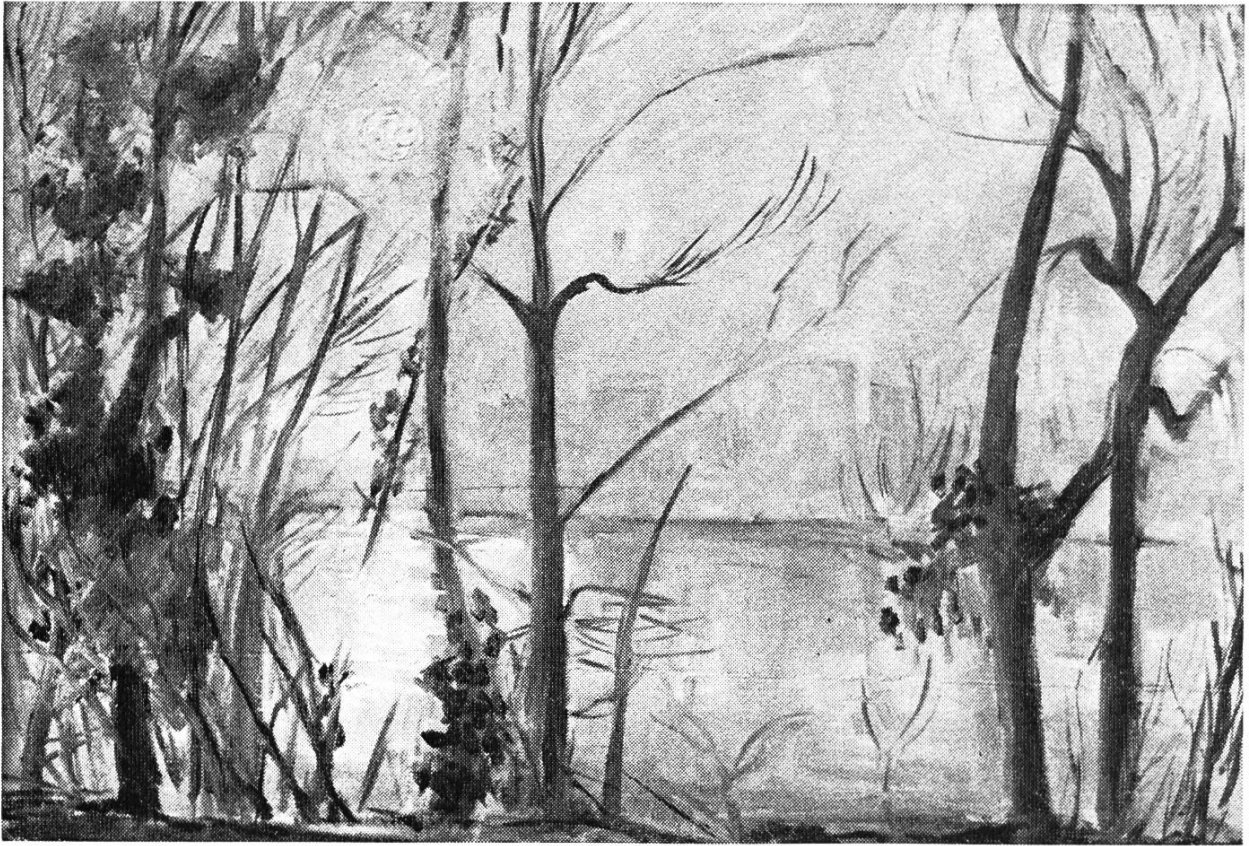
Bild 3. Blick vom Kleinbaslerufer auf Birsfelden, Morgenstimmung. Nach einem Oelbild von Georg Matt.

anzunehmen. Seine fundierte Ausbildung als Künstler und Lehrer kam in der Folge der Realschule Muttenz zu gute, wo er bis 1974 als Zeichenlehrer wirkte.