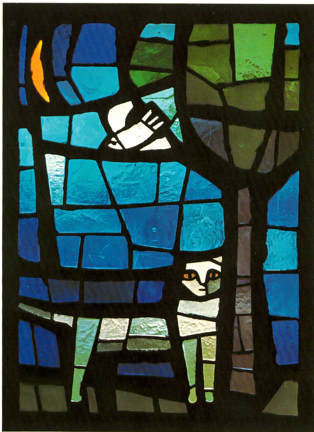
Bild 2. Ausschnitt aus dem Glasbilderzyklus «Wald, Garten, Katze und Vogel» (Beton- scheiben) im Sekundarschulhaus Birsfelden.