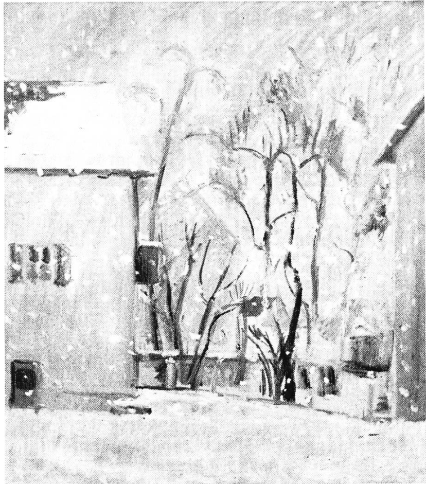
Bild 4. Wohnquartier Hardhügel Birsfelden bei Neuschnee. Nach einem Oelbild von Georg Matt.