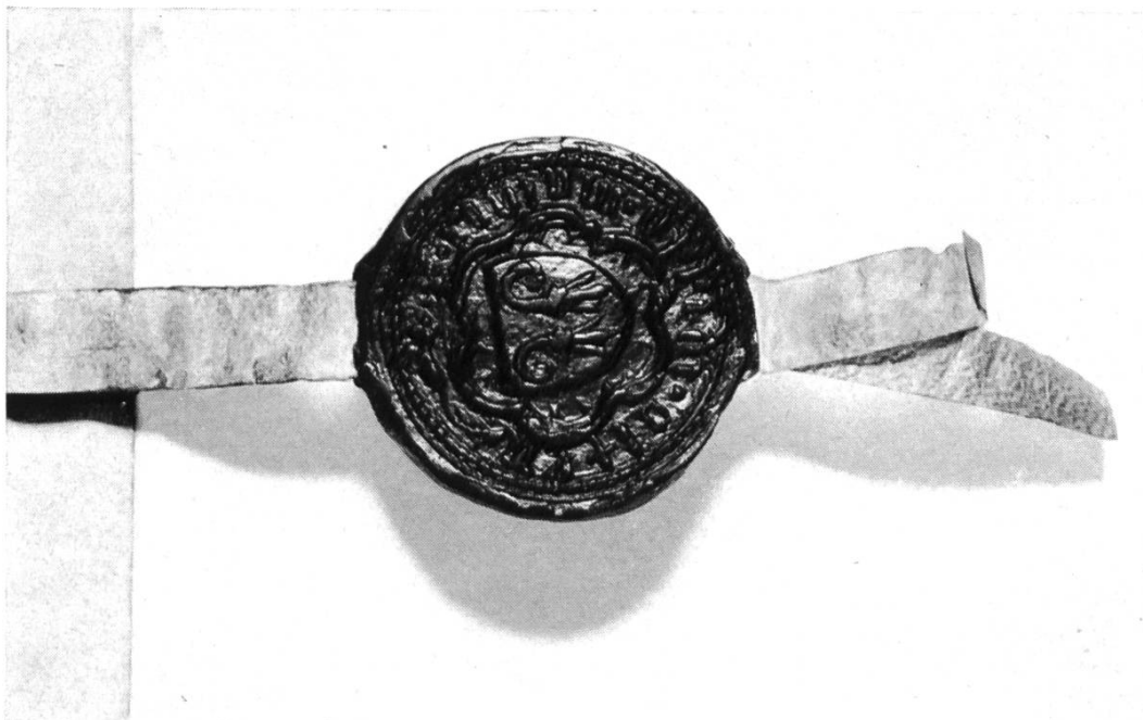
Bild 2. Stadtsiegel von Olten mit zwei voneinander gekehrten Baselstäben. Urkunde Kloster Schöntal Nr. 51, 1446, im Staatsarchiv Basel.