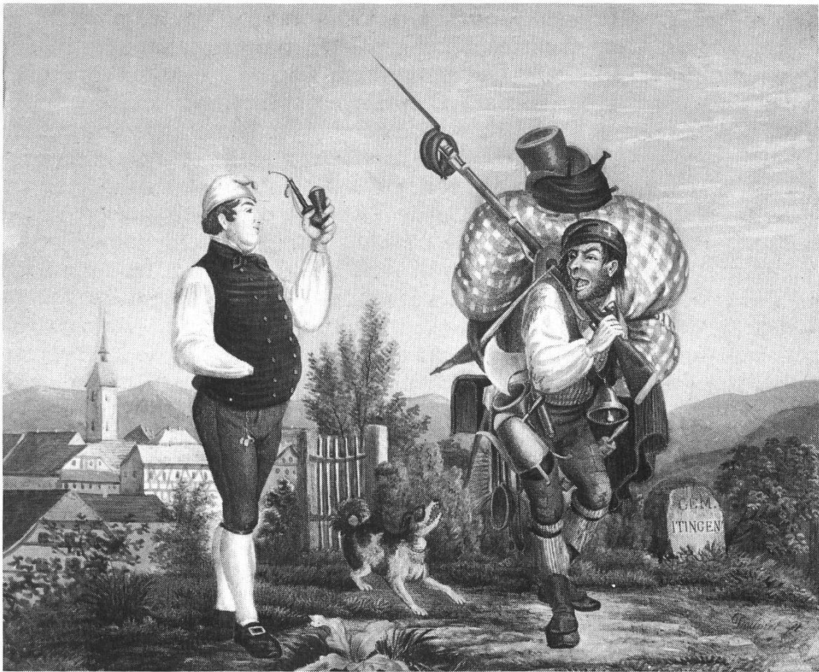
Bild 3. Nach dem Gelterkinder-Sturm. Aufschrift: «He Nochber! s het schynts wohl usgeh dört obe?» — «Me mues si ämmel wehre für sy grächti Sach!» Kolorierte Lithographie von Adolf Doudiet (1807—1872).

Soldaten gelegt, und der Beschädigte erhielt am meisten, so war besser gelitten und geschwiegen».