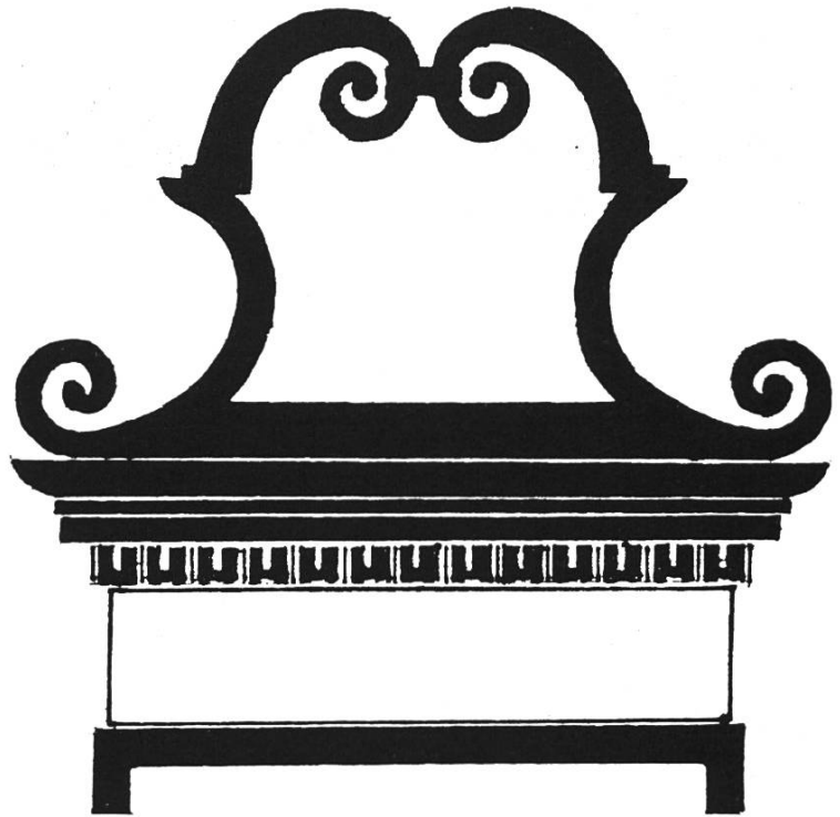
Bild 8. Aufbau über Rahmenfüllungen an Kanzelwänden und Schranktüren.