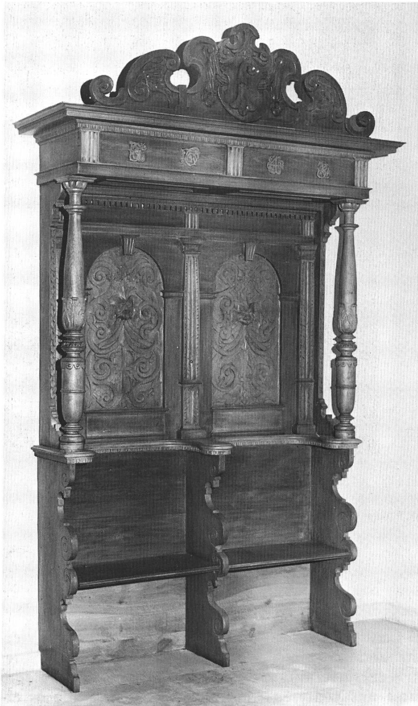
Bild 3. Pfarrstuhl, Kirche Sissach, 1643, erstellt von Peter Hoch, Liestal.

recht verschiedener Manier gestaltet (Bild 8). Dieser Aufbau kann an Schränken des 17. Jh. vielfach beobachtet werden. Er erscheint aber an der kleinen Auswahl von Werken Peter Hochs, die wir bis heute kennen gelernt haben, in konstanter Folge. Für seinen persönlichen Stil massgebend ist das Schnitzwerk, mit dem er seine Schöpfungen ausschmückt. Diese sind in einer für seine Zeit einfachen, natürlichen, vielleicht etwas bodenständigen Art ohne Pomp gestaltet.