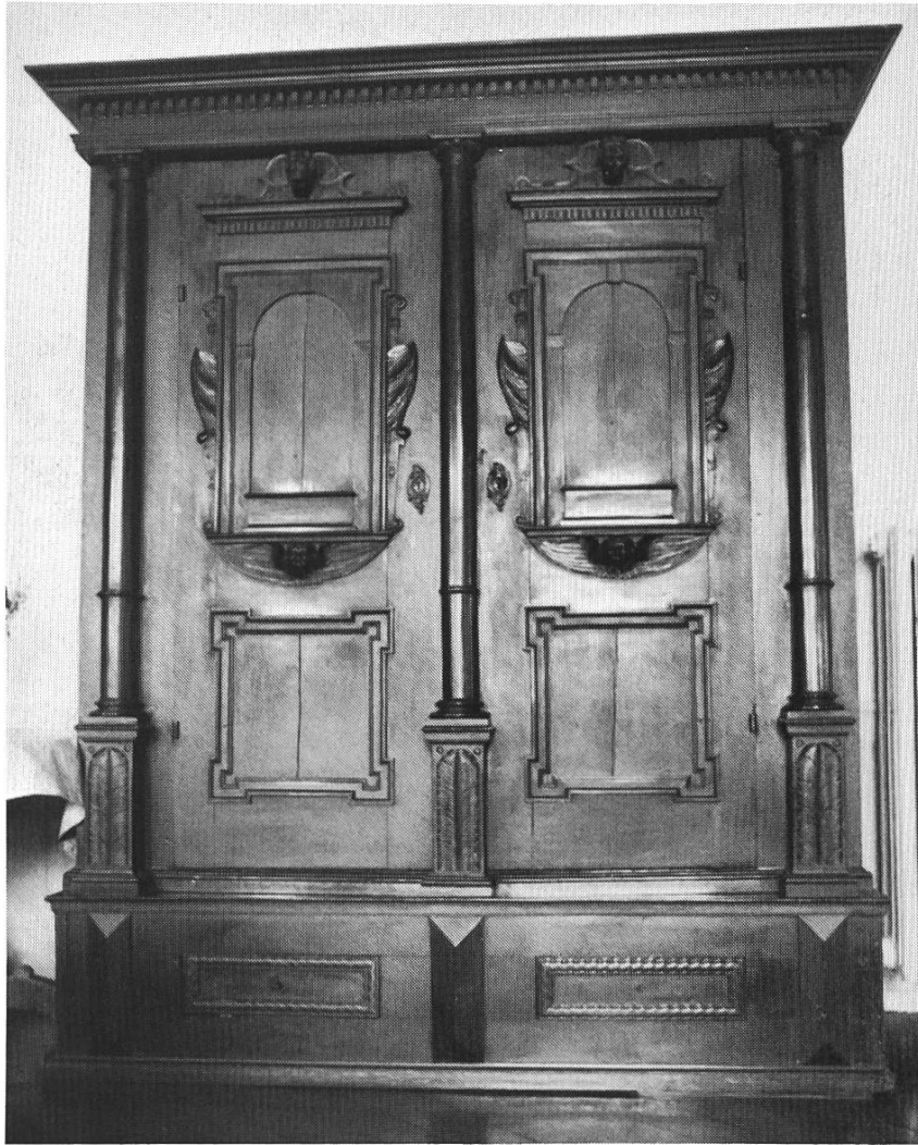
Bild 9. Schrank auf Bienen- berg. Vergleiche die geschnitzte Verzie- rung seitlich des Füllungsrahmens mit Bild 10.