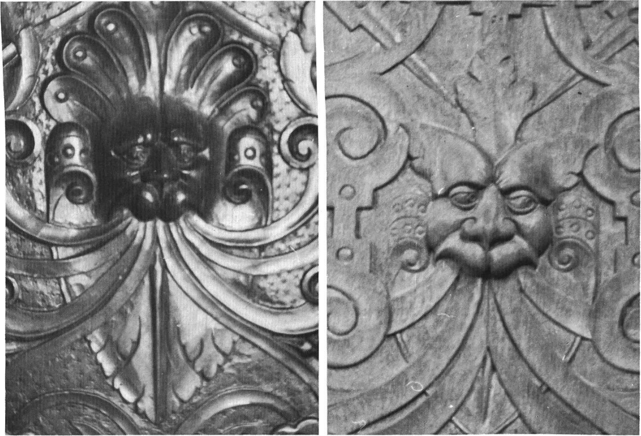
Bilder 5. Blattmaske a) am Spörlin-Schrank b) am Pfarrstuhl, Kirche Sissach.

haben, in Berührung gekommen ist. Diese Kunst des Schnitzens, die damals grosse Mode war, hat er sich mit Eifer angeeignet. Es kann angenommen werden, dass er das Schreinerhandwerk bei seinem Vater erlernt hat. Wohin er auf seiner Wanderschaft gekommen ist und welche Gegenden er besucht hat, ist nicht bekannt. Zu Zwecken der beruflichen Ausbildung scheint er sich nie für längere Zeit in Basel aufgehalten zu haben. Sein Name ist in den Büchern der Spinnwetternzunft in den fraglichen Jahren nicht zu finden. Trotzdem sind in seinen Arbeiten gewisse Anklänge an die Täferschnitzerei z. B. im Bärenfelserhof in Basel zu erkennen. Diese ist zu Beginn des 17. Jahrhunderts (1607) entstanden. Die Quelle dieser Zusammenhänge könnte aber auch in den damals in grösserer Anzahl erschienenen Musterbüchern zu suchen sein.