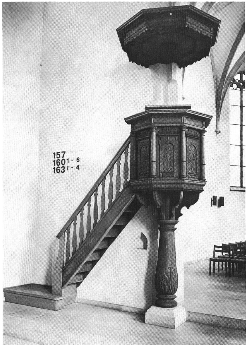
Bild 2. Kanzel, Kirche Sissach, 1642, erstellt von Peter Hoch, Liestal.

sitz des Kantonsmuseums Liestal. Es scheint, als ob Peter Hoch in den vierziger Jahren des 17. Jahrhunderts seinen Werken ein stilistisch passendes Ursprungszeichen seiner Werkstatt mitgegeben hätte. Alle Schränke sind neben dem typischen Band mit weiteren Merkmalen versehen, die es erlauben, ihre Herkunft mit einiger Sicherheit zu belegen. So sind alle von ihm verwendeten gedrechselten Säulen glatt, verjüngen sich nach oben und tragen im unteren Drittel einen schmalen Wulst 6 . Auffallend ist der stets wiederkehrende Aufbau der Hauptfronten seiner Werke. Ueber dem Füllungsrahmen, der reichhaltig geschnitzt, aber auch mit letzter Einfachheit gestaltet sein kann, folgen nacheinander von unten nach oben ein querliegendes Zwischenstück, das glatt oder mit Schnitzerei verziert ist, dann das typische Peter Hoch-Band und ein mehrfach abgestuftes Gesimse wechselnder Art. Schliesslich folgt darauf aufsitzend ein seitlich in Spiralen oder Blätter auslaufendes Schweifwerk. Seine Form und sein Inneres sind in