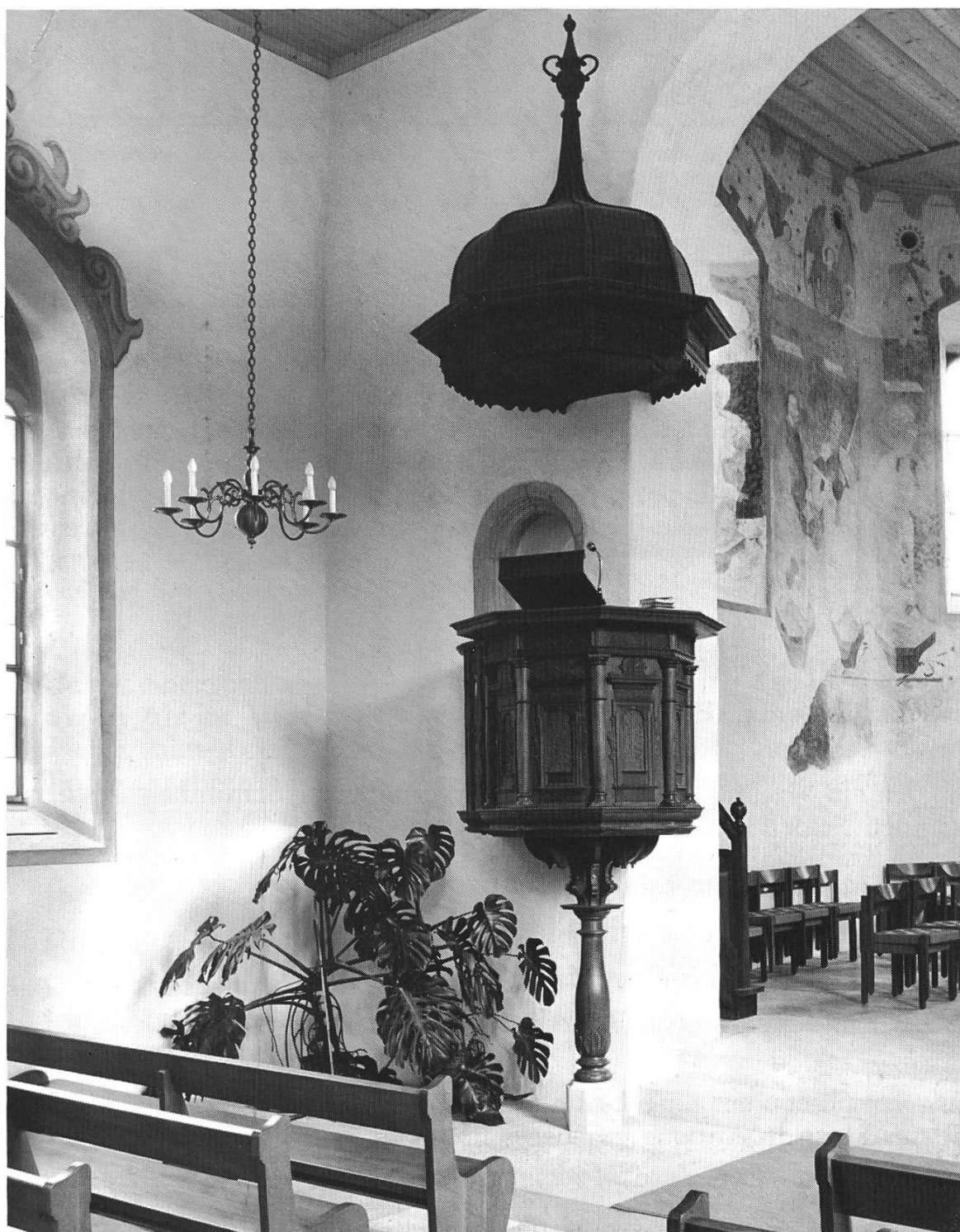
Bild 6. Kanzel, Kirche Gelterkinden.

zess verwickelt. Auf der Folter bezeugte er seine Unschuld. Wegen Besitzens eines teuflischen Büchleins und von Zauberzetteln gegen Hauen und Stechen, die seine Frau in die Uniform genäht hatte, und des Versuchs, ehrliche Personen durch zauberische Mittel zur Liebe anzureizen, wurde er 1627