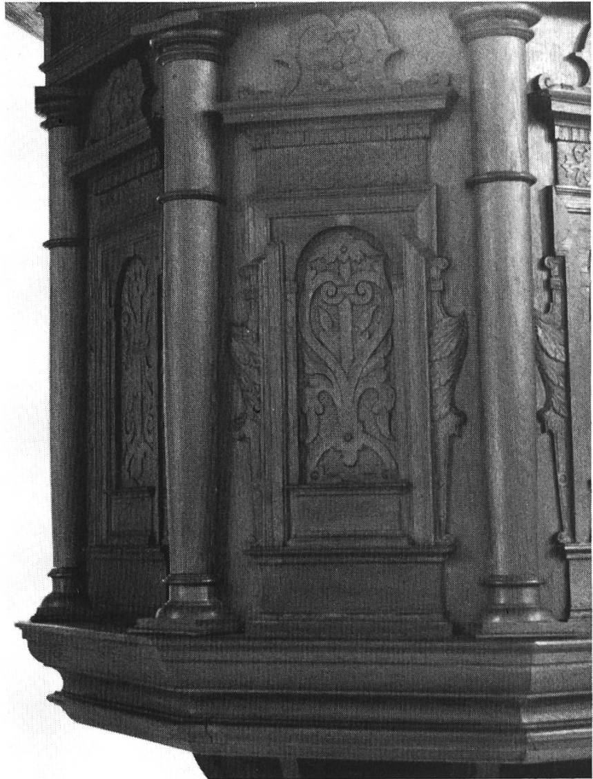
Bild 10. Detailaufnahme der Kanzel, Kirche Gelterkinden.