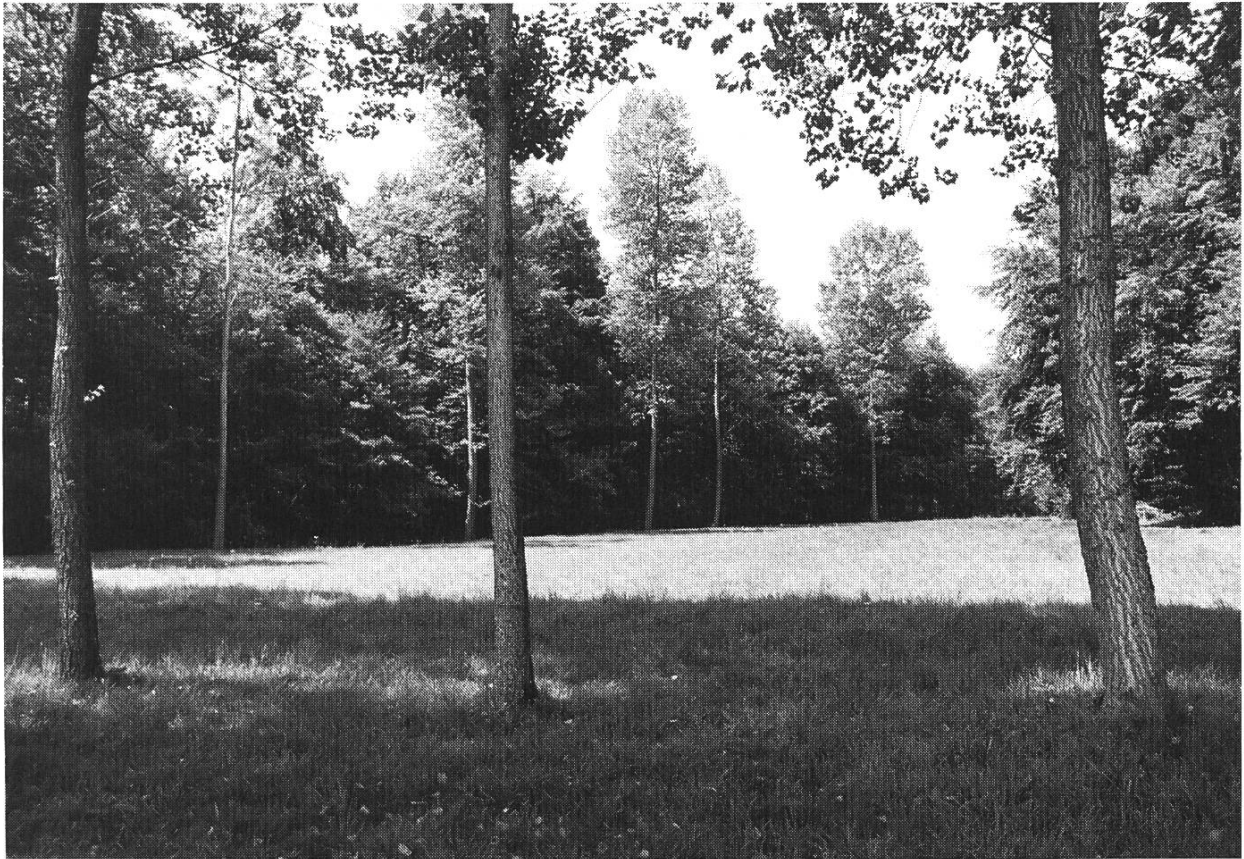
Bild 3. Biel-Benken, Holzmatt, Naturschutz-Reservat.

Giebenach, Hauptstrasse 20. Ehemaliges Bauernhaus am Dorfplatz mit Wohn- und Oekonomieenteil; Jahrzahl 1764 auf dem Scheunentorbogen, Fenster des Wohnteils etwas neuer, doch am Giebel kleines gotisches Fenster. Hinter dem Haus steht ein giebelständiger, gemauerter Speicher mit rundbogigem Eingang. Die ganze Hofanlage vor kurzem vorbildlich restauriert, wobei man den Speicher als Wohnung einrichtete und den Stall für Nebenräume und das Treppenhaus verwendete. Die Wiese zwischen Strasse und Haus wurde in einen Bauerngarten mit von Buchs eingefassten Beeten und einem Springbrunnen in der Mitte des Gartens umgewandelt. Regierungsratsbeschluss Nr. 235 vom 2. Februar 1982.