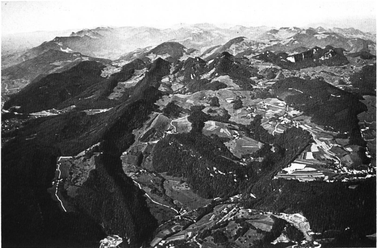
Bild 2. Unterer Hauenstein. Flugaufnahme von Hans Buser, 1970. Aufnahmeort: über der Frohburg. Im Vordergrund Südseite des Unteren Hauensteins mit den Ortschaften Hauenstein und Ifenthal. Hinter Ifenthal Ifleter Berg, Challhöchi und Belchenflue. Südliche Zugänge zum Chall: Weg durch den Oswald und von Ifenthal her.

anderen Ortschaften erwähnt wird 56 . Bevor Basel die Landschaft erworben und hier das Salzmonopol geltend gemacht hatte, bezog man vermutlich im ganzen Ergolzgebiet das Salz von Rheinfelden 57 . Sogar nachdem Basel eidgenössisch und später reformiert geworden war, lieferte Rheinfelden weiterhin Elsässer und Markgräfler Wein nach Sissach und Gelterkinden 58 .